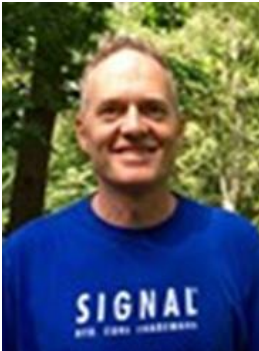
😊 MARSCHA 😊