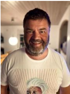
😊 BORRIS 😊