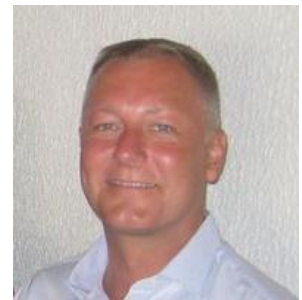
😊 HØJGÅRD 😊