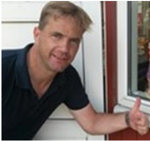
😊 TYNDE 😊