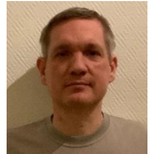
😊 AMIGO 😊

😊 TYNDE fra 2. DT's øvre halvdel kørte på den store klinge i de to første kampe og TYNDE var allerede klar til Finalerunden inden den sidste kamp, så det gjorde ikke noget at den sidste kamp mod AMIGO blev tabt. TYNDE sikker vinder af puljen og TYNDE er nu klar til optræde på de skrå Divisions Cup brædder i Finalerunden 😊