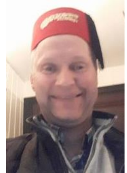
👎 FOREST 👎