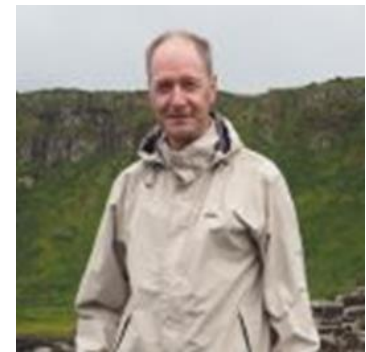
🙄 LUND 🙄