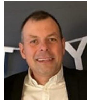
🙄 UNITED 🙄

🙄 MAGPIES havde med en afsluttende storsejr en chance for at hoppe over stregen, men det blev i stedet til et nederlag mod CSKA, så MAGPIES er hermed færdig i Liga Cup 'en 2023. FLINCA fra toppen af den bedste Liga-række, var overraskende sat af allerede inden den sidste kamp og den afsluttende afklapsning fra FRYDKÆR, gjorde ikke situationen bedre, så dermed smuttede profilen FLINCA ud af Liga Cup 'en. UNITED den nye tipper i Liga 'ens 3. division kunne ikke rigtig følge med her i Indledende runde, men fik dog trods alt gang i pointtavlen med den afsluttende storsejr over MAGPIES, men det var for sent og Liga Cup 'en er forbi for UNITED for denne gang 🙄