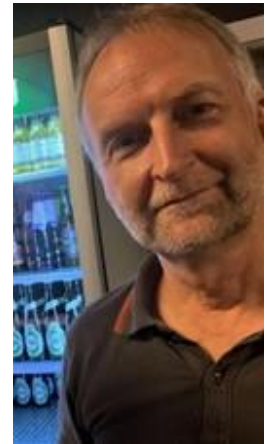
😊 CULOPIP 😊

😊 CSKA fra Liga 'ens 2. division var allerede klar til Mellemrunden efter fire kampe, men sluttede alligevel af med en storsejr i puljens topkamp mod CULOPIP, så en sikker topplacering til CSKA her i Indledende runde. FRYDKÆR fra den bedste Liga-række skulle bruge mindst uafgjort i den sidste kamp for at blive over stregen og der var ingen problemer for FRYDKÆR , for det blev til en ren afklapsning over FLINCA, så dermed er FRYDKÆR , der har en 3. plads fra Liga Cup 'en 2015 i bagagen, også klar til Mellemrunden. CULOPIP fra 2. Liga sluttede i sidste sæson på 2. pladsen her i Liga Cup 'en, men var truet over stregen lige til det sidste, men selv om det kun blev til uafgjort i den sidste kamp mod FLINCA, så sluttede CULOPIP sikkert over stregen og er nu klar til Mellemrunden 😊