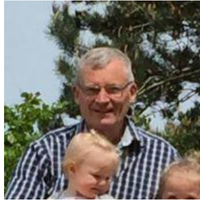
😊 FRYDKÆR 😊