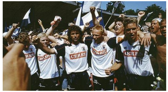
Pokalfinale 1992: AGF – B1903: 3-0

https://www.facebook.com/watch/?v=10155325697547498