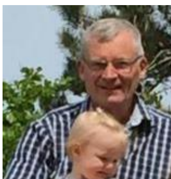
😞 FRYDKÆR 😞