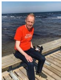
😊 FOX 😊

Pulje 5: FRYDKÆR (1), SELECT (1), TØFTING (1), AMIGO (2) , FOX (2) , MURER (2).