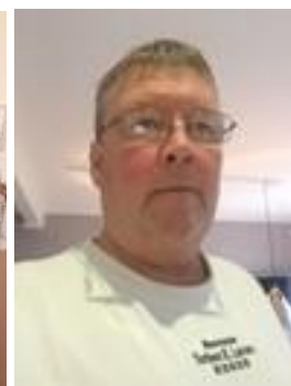
😞 MURER 😞

😞 SELECT lå ellers mageligt lige over stregen inden den sidste kamp, men der skulle en afsluttende sejr til mod FOX , for at billetten med sikkerhed var hjemme, men SELECT opnåede kun uafgjort mod FOX og dermed drattede SELECT ned under stregen og er nu ude af Liga Cup'en. FRYDKÆR havde før den sidste kamp kun en yderst teoretisk chance for at gå videre, men selv om FRYDKÆR sluttede af med en storsejr over MURER , så lykkedes det ikke og FRYDKÆR er ude af Liga Cup'en. TØFTING havde chancen men kiksede i den afgørende kamp mod AMIGO og dermed er TØFTING ude af årets Liga Cup. MURER var stort set uden chance inden den sidste kamp og med det afsluttende nederlag mod FRYDKÆR var løbet kørt og Liga Cup'en var forbi for MURER 😞