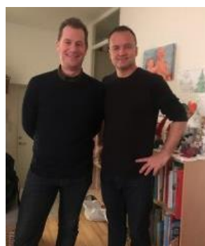
😞 TØFTING 😞