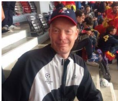
🙄 PIQUET 🙄