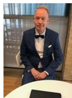
👤 PIQUET 👤