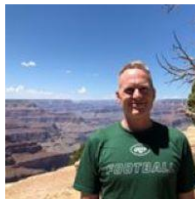
😞 MARSCHA 😞

😞 COTTEE fra 3. Liga kunne med en sejr i den afsluttende kamp, kvalificere sig til Mellemrunden, men det blev kun til uafgjort mod LUFCMOT og dermed forblev COTTEE under stregen og er hermed færdig i årets Liga Cup. NUSER fra topfeltet af 2. Liga kunne ikke få det til at køre og NUSER var allerede sat af inden sidste kamp, så Liga Cup 2023 er forbi for NUSER . MARSCHA er 1. Liga-tipper og Liga Cup Mester 2014, men denne sæson i Liga Cup'en skal MARSCHA vist glemme hurtigst muligt, for fem kampe og 0 point er meget overraskende og noget af en bet for MARSCHA 😞