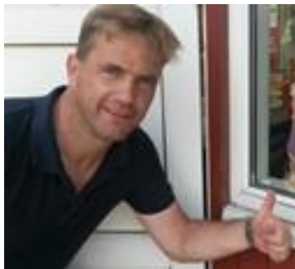
😊 TYNDE 😊