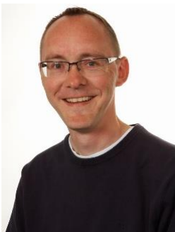
👤 MCCOIST 👤