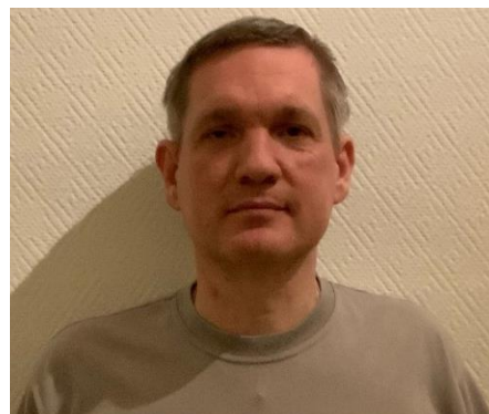
😊 AMIGO 😊

😊 STOKE fra toppen af den bedste række, var allerede klar til Mellemrunden efter de første fire kampe og uafgjort i den sidste kamp mod AGGER , var nok til at holde fast i puljens 1. plads, så næste stop for STOKE er Mellemrunden. NIELSEN var ubesejret og allerede klar til Mellemrunden efter de første fire kampe, så måske derfor tog NIELSEN lidt løst på den femte kamp mod AMIGO , som han tabte, men billetten til Mellemrunden var klar. AMIGO skulle vinde den sidste kamp, for at have en chance for at komme over stregen og det var lige netop det AMIGO gjorde med sejren over NIELSEN og dermed smuttede AMIGO lige over stregen og AMIGO er nu klar til Mellemrunden 😊