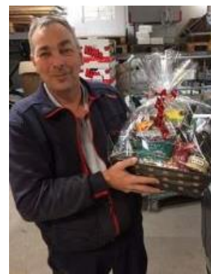
😞 LUCKY 😞

😞 AGGER fra den bedste Liga-række har fine papirer her i Liga Cup'en i form af Liga Cup Mesterskabet i 2015 og 3. pladsen i 2020 og alting så lyst ud for AGGER inden den sidste kamp, hvor AGGER lå lige over stregen, så det eneste krav var en afsluttende sejr mod puljevinderen STOKE , så ville den være hjemme, men desværre for AGGER blev det kun til uafgjort og dermed dumpede AGGER ned inder stregen og er færdig i årets Liga Cup. LIVPOOL fra 3. Liga var stået helt af, men sluttede dog af med en sejr over LUCKY , men Liga Cup'en er forbi for LIVPOOL . LUCKY også fra 3. Liga måtte forlade Liga Cup'en uden et eneste point på kontoen, så det var en lidt tam omgang fra LUCKY 's side 😞