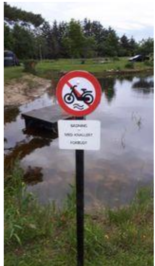
Skilt vi har oppe til træf, men der ryger alligevel en i hvert år 🚲🚲