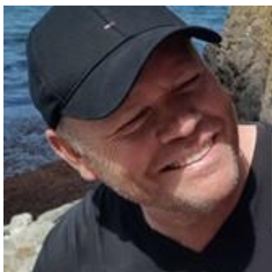
😞 LIVPOOL 😞