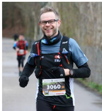
😊 NIELSEN 😊