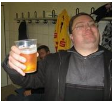
👤 LIONS 👤