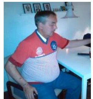
👤 LUCKY 👤

👤 LIONS var før den sidste kamp lidt på hælene nede på 9. pladsen, men det var ikke umuligt at komme over stregen og i den afsluttende kamp uddelte LIONS en ordentlig øretæve til CHELSEA , men det var alligevel ikke nok og LIONS må forlade Divisions Cup'en for denne gang, dog med oprejst pande for den fine afslutning 👤 NIELSEN lå før den sidste kamp lige over stregen og havde det ene ben i Mellemrunden, - det krævede blot en sejr, men NIELSEN kunne kun hive et lidt tyndt uafgjort resultat hjem i den afsluttende kamp mod AMIGO og dermed dumpede NIELSEN ned under stregen og det er forbi for denne gang 👤 PERCY der ellers hører til i frontgruppen i 2. DT, havde ikke heldet med sig i årets Divisions Cup. Før den sidste kamp lå PERCY lige under stregen og kravet for at have en chance var sejr i den afsluttende kamp mod HIMBO , men det blev tværtimod til en mindre afklapsning og så var PERCY helt færdig i Divisions Cup 2023 👤 LUCKY var faktisk Divisions Cup Mester i den bedste række i 2015, men nu er det i 2. division det foregår og Divisions Cup'en har ikke været den helt store succes for LUCKY , der var sat helt af allerede inden den sidste kamp, så Divisions Cup'en er forbi for denne gang for LUCKY 👤