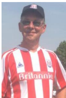
😊 STOKE 😊