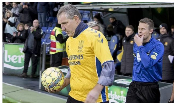
1. juni 1998: En klublegende siger farvel som matchvinder med flot scoring