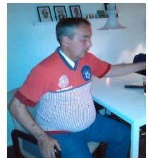
👤 LUCKY 👤

👤 LIONS var før den sidste kamp lidt på hælene nede på 9. pladsen, men det var ikke umuligt at komme over stregen og i den afsluttende kamp uddelte LIONS en ordentlig øretæve til CHELSEA , men det var alligevel ikke nok og LIONS må forlade Divisions Cup'en for denne gang, dog med oprejst pande for den fine afslutning 👤 NIELSEN lå før den sidste kamp lige over stregen og havde det ene ben i Mellemrunden, - det krævede blot en sejr, men NIELSEN kunne kun hive et lidt tyndt uafgjort resultat hjem i den afsluttende kamp mod AMIGO og dermed dumpede NIELSEN ned under stregen og det er forbi for denne gang 👤 PERCY der ellers hører til i frontgruppen i 2. DT, havde ikke heldet med sig i årets Divisions Cup. Før den sidste kamp lå PERCY lige under stregen og kravet for at have en chance var sejr i den afsluttende kamp mod HIMBO , men det blev tværtimod til en mindre afklapsning og så var PERCY helt færdig i Divisions Cup 2023 👤 LUCKY var faktisk Divisions Cup Mester i den bedste række i 2015, men nu er det i 2. division det foregår og Divisions Cup'en har ikke været den helt store succes for LUCKY , der var sat helt af allerede inden den sidste kamp, så Divisions Cup'en er forbi for denne gang for LUCKY 👤