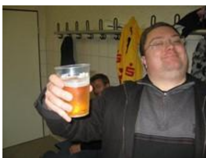
😞 LIONS 😞