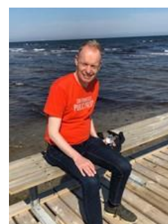
😞 FOX 😞

😞 STOKE fra toppen af den bedste LIGA-række, havde lige til det sidste en teoretisk chance for at komme op på en finale-plads, men den gik ikke og Ligaens topscorer STOKE er overraskende ude af Liga Cup 2023 😞 LIONS fra bunden af den bedste LIGA-række, havde også en teoretisk chance lige til det sidste, men det afsluttende nederlag mod ZICO satte en stopper for alle spekulationer og LIONS er færdig i Liga Cup ´en 😞 FOX fra A-puljen i 2. LIGA, har ellers flotte papirer fra Liga Cup ´en i form af en 2. plads i 2009 og en 3. plads i 2013, men her i Semifinalerunden kiksede det helt for FOX , der hermed er ude af årets Liga Cup 😞