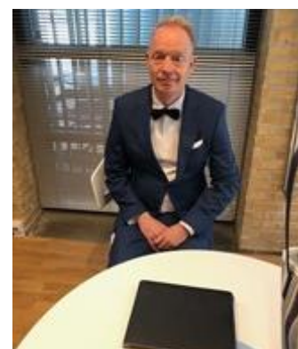
😊 PIQUET 😊

😊 VINDING fra 2. Liga har en flot Liga Cup 2. plads fra 2017 i bagagen og her i denne pulje spurtede VINDING fra alle puljens øvrige deltagere og med fire indledende sejre havde VINDING allerede for længe siden sikret sig en billet til Mellemrunden, så at det kun blev til uafgjort i den sidste kamp mod ZICO betød ikke noget. ZICO huserer også i 2. Liga og faktisk har ZICO opnået den triumf at vinde Liga Cup 'en i 2010. ZICO havde allerede kvalificeret sig til Mellemrunden inden sidste kamp, hvor ZICO spillede uafgjort mod puljevinderen VINDING . PIQUET var i høj grad truet på pladsen lige over stregen og skulle i den afsluttende kamp ud i et drabeligt opgør mod HALVOR lige under stregen og med en beskedent sejr lykkedes det for PIQUET at holde fast i puljens 3. plads og dermed er PIQUET videre til Mellemrunden 😊