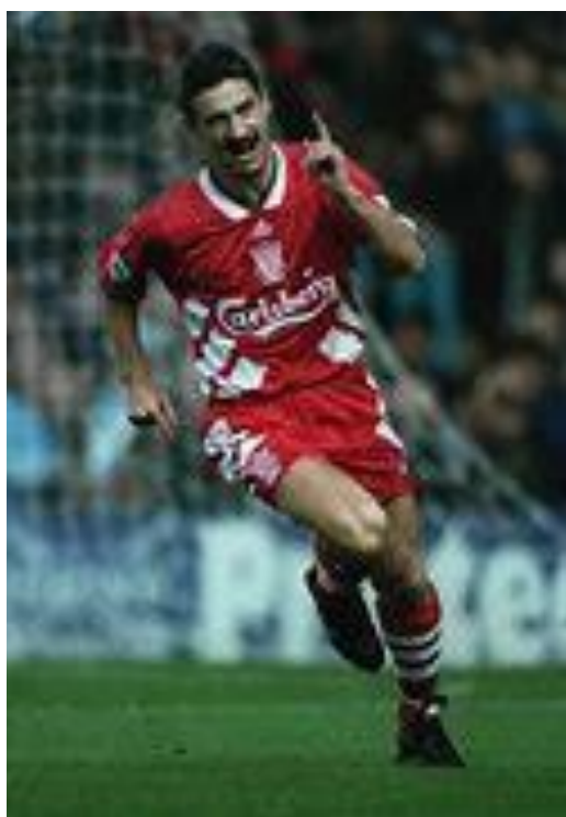
Liverpool legende Ian Rush