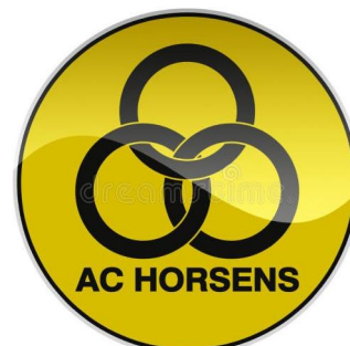
CASA Arena Horsens

Bayern München må jeg også fremhæve. Der kom min store kærlighed til sammen med Lerby og Uli Hoeness. Hoeness mestren over alle på hovedstød.