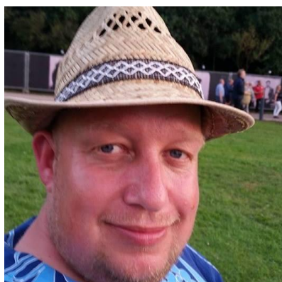
🙄 KAILUA 🙄

😊 VINDING fra 2. Liga har en flot Liga Cup 2. plads fra 2017 i bagagen og her i denne pulje spurtede VINDING fra alle puljens øvrige deltagere og med fire indledende sejre havde VINDING allerede for længe siden sikret sig en billet til Mellemrunden, så at det kun blev til uafgjort i den sidste kamp mod ZICO betød ikke noget. ZICO huserer også i 2. Liga og faktisk har ZICO opnået den triumf at vinde Liga Cup'en i 2010. ZICO havde allerede kvalificeret sig til Mellemrunden inden sidste kamp, hvor ZICO spillede uafgjort mod puljevinderen VINDING . PIQUET var i høj grad truet på pladsen lige over stregen og skulle i den afsluttende kamp ud i et drabeligt opgør mod HALVOR lige under stregen og med en beskeden sejr lykkedes det for PIQUET at holde fast i puljens 3. plads og dermed er PIQUET videre til Mellemrunden 😊