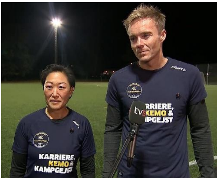
To tidligere kræftramte vil hjælpe virksomheder til at kunne tage den svære snak.