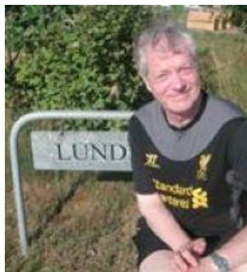
😊 ZICO 😊