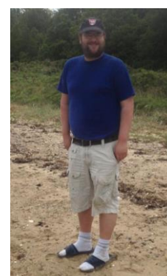
🙄 HIMBO 🙄

🙄 KAILUA fra 3. Liga havde chancen lige til det sidste, men det krævede uafgjort i opgøret mellem PIQUET og HALVOR og så en afsluttende sejr over HIMBO og det sidste klarede KAILUA , men desværre for ham blev der en vinder i det omtalte opgør, så KAILUA blev lige under stregen og hermed er Liga Cup'en forbi for denne gang. HALVOR skulle vinde den sidste kamp, for at hoppe over stregen og det skete jo som bekendt ikke i den spændende kamp mod PIQUET , så HALVOR er hermed ude af Liga Cup 2023. HIMBO havde en yderst teoretisk chance for at komme over stregen, men med det afsluttende nederlag mod KAILUA , forsvandt enhver mulighed og HIMBO er ude af årets Liga Cup 🙄