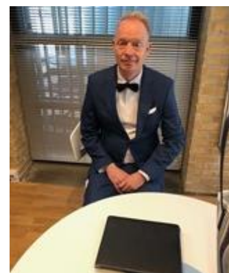
😊 PIQUET 😊

😊 VINDING fra 2. Liga har en flot Liga Cup 2. plads fra 2017 i bagagen og her i denne pulje spurtede VINDING fra alle puljens øvrige deltagere og med fire indledende sejre havde VINDING allerede for længe siden sikret sig en billet til Mellemrunden, så at det kun blev til uafgjort i den sidste kamp mod ZICO betød ikke noget. ZICO huserer også i 2. Liga og faktisk har ZICO opnået den triumf at vinde Liga Cup'en i 2010. ZICO havde allerede kvalificeret sig til Mellemrunden inden sidste kamp, hvor ZICO spillede uafgjort mod puljevinderen VINDING . PIQUET var i høj grad truet på pladsen lige over stregen og skulle i den afsluttende kamp ud i et drabeligt opgør mod HALVOR lige under stregen og med en beskeden sejr lykkedes det for PIQUET at holde fast i puljens 3. plads og dermed er PIQUET videre til Mellemrunden 😊