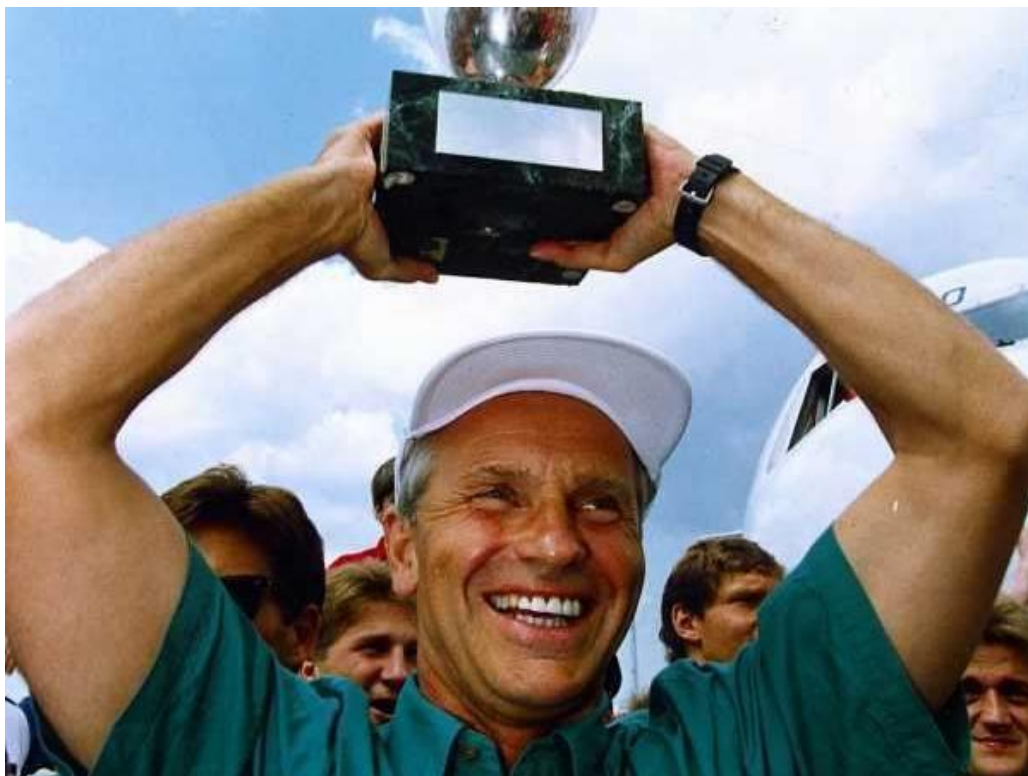
🤔 RICARDO var også en af mine store idoler 🤔