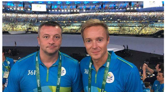
Den danske topdommerduo er blevet udpeget af det internationale håndboldforbund, IHF, til at dømme ved VM-slutrunde i Danmark og Tyskland (2018)