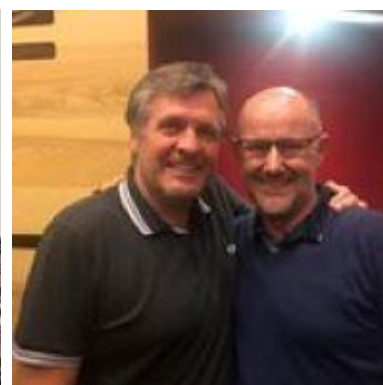
😞 NANDO 😞

😞 BENBO fra den bedste Liga-række var allerede sat af inden den sidste kamp, så kæmpe sejren over NANDO hjalp ikke og BENBO er færdig i Liga Cup'en. HEDE lå lige under stregen inden den sidste kamp, der ellers var en afgørende kamp mod STOKE om billetten til Semifinalerunden, men HEDE fik et ordentlig slag og er hermed ude af årets Liga Cup. SPVK havde chancen lige til det sidste og med en sejr over PIQUET havde billetten været hjemme, men det blev til en på hatten i stedet for og dermed er SPVK ude af Liga Cup'en. NANDO var stort set ikke til stede i denne pulje og fik kun en enkelt pind ind på pointtavlen, så Liga Cup 2023 er forbi for NANDO 😞