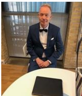
😊 PIQUET 😊

Pulje 2: BENBO (1), PIQUET (1), STOKE (1), NANDO (2), HEDE (3), SPVK (3).