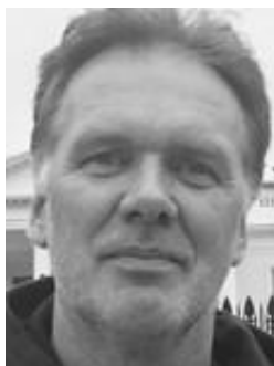
🐇 JESPER 🐇