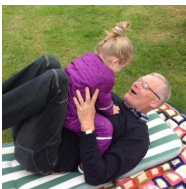
😞 BENBO 😞

😊 STOKE fra toppen af den bedste Liga-række, var før den sidste kamp hårdt presset lige over stregen, så det var nødvendigt med en sejr til STOKE i den sidste kamp mod HEDE og det lykkedes for STOKE at hive en store sejr hjem og dermed er STOKE klar til Semifinalerunden 😊