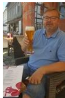
🐇 HEDE 🐇