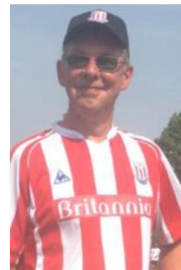
😊 STOKE 😊

😊 PIQUET fra den bedste Liga-række førte puljen inden den sidste kamp, men skulle bruge en sejr for at være helt sikker og det levede PIQUET helt op til med store sejren over SPVK og dermed er PIQUET klar til Semifinalerunden 😊