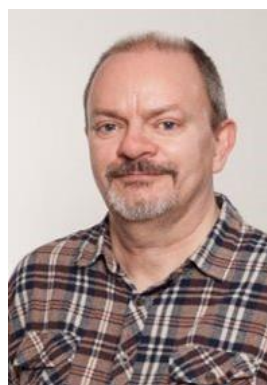
😞 SPVK 😞