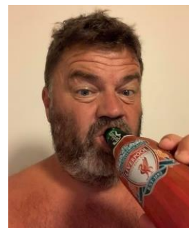
🐇 BORRIS 🐇

🐇 JESPER var med på vognen lige til det sidste, men kravet var en sejr i den afsluttende kamp mod SCHØN og så ellers håbe på lidt medvind. JESPER klarede kravet med en sejr over SCHØN, men så var der heller ikke mere der flaskede sig for JESPER og det lykkedes ikke at kravle op over stregen, så Divisions Cup ´en 2023 er forbi for JESPER 🐇 BORRIS lå lige under stregen før den sidste kamp og med en afsluttende sejr ville chancen være der, men det lykkedes kun for BORRIS at hive et uafgjort resultat hjem og dermed forduftede enhver chance og BORRIS må se i øjnene at Divisions Cup ´en er forbi for denne gang 🐇 HEDE havde også en meget teoretisk chance før den sidste kamp, men alle spekulationer forsvandt som dug for solen, da HEDE tabte den afsluttende kamp mod ANDERUP og hermed er HEDE færdig her i Divisions Cup ´en 🐇 LCFSIF der har det svært i DT `s 3. division, havde også store problemer i Divisions Cup ´en og var sat helt af inden den sidste kamp, hvor LCFSIF måtte se sig besejret af MANUTD og dermed er LCFSIF ude af årets Divisions Cup 🐇