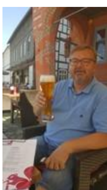
😞 HEDE 😞