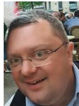
🙄 FUTTE 🙄

🙄 CHELSEA fra 2. Liga kunne med en sejr i den afsluttende kamp, i heldigste fald slutte over stregen, men CHELSEA formåede kun at hive et uafgjort resultat hjem mod FOX og dermed er CHELSEA ude af årets Liga Cup. HARRY fra toppen af den bedste række, viste en skuffende omgang her i årets Liga Cup, der sluttede af med en uafgjort bundkamp mod FUTTE og så var Liga Cup 'en 2023 forbi. FUTTE der også huserer i den bedste Liga-række, var også meget sløjt kørende i årets Liga Cup og da FUTTE måtte nøjes med uafgjort i den afsluttende kamp mod HARRY , forblev FUTTE fra den bedste række, sammen med HARRY også fra den bedste række, helt nede i puljens bund, totalt sat af og færdige 🙄