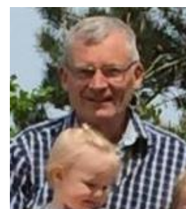
😞 FRYDKÆR 😞