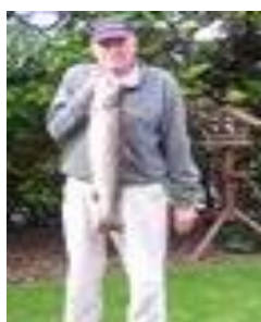
😞 VIPTIP 😞

😊 IDSKOV er den eneste af de nuværende medlemmer, der har vundet Divisions Cup 'en to gange, nemlig i årene 1989 og 2021. IDSKOV var ude i en vigtig afsluttende kamp mod Divisions Cup Mesteren 2002 FRYDKÆR og her kunne IDSKOV nøjes med uafgjort, men alligevel kørte IDSKOV for fuld skrue og der blev hevet en kneben sejr i land og dermed er IDSKOV igen klar til Finalerunden i Divisions Cup 'en 😊