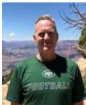
😊 MARSCHA 😊