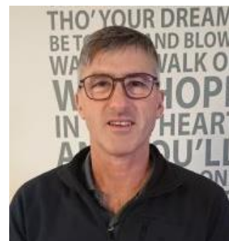
😊 IDSKOV 😊