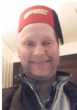
🙄 FOREST 🙄