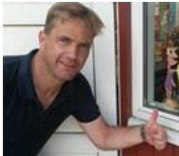
👤 TYNDE 👤