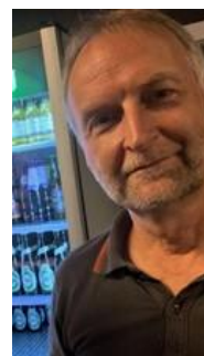
👤 CULOPIP 👤