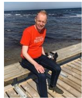
👤 FOX 👤