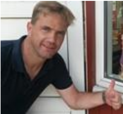
😊 TYNDE 😊