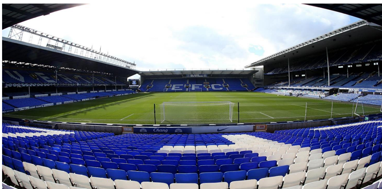
Goodison Park Stadium