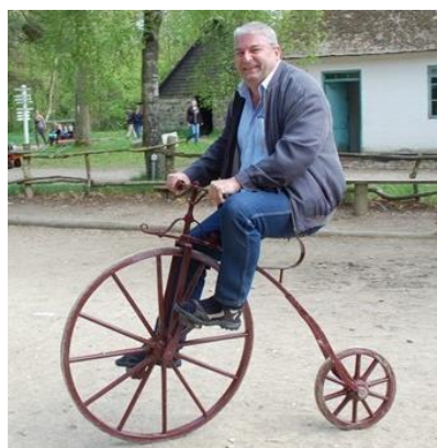
😞 NUSER 😞