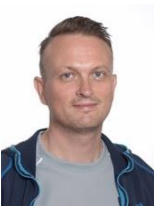
😞 COTTEE 😞

😊 TYNDE fra den bedste række chokerede her i den Indledende runde, hvor TYNDE fejede alt modstand til side og dermed vandt de første fire kampe og kun i den afsluttende kamp mod MARSCHA måtte TYNDE nøjes med uafgjort. TYNDE er hermed på overbevisende vis videre til Mellemrunden. MURER fra 2. Liga var udsat inden den sidste kamp og skulle helst have point i kampen mod NUSER og her lykkedes det for MURER at hive et uafgjort resultat hjem og så var billetten til Mellemrunden hjemme. LUFCMOT fra 3. Liga, lå inden den sidste kamp lige over stregen og skulle møde COTTEE lige under stregen og kravet var mindst uafgjort og det krav opfyldte LUFCMOT , så billetten til Mellemrunden blev hermed sikret 😊