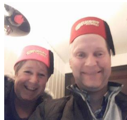
😊 FOREST 😊

😊 ARSENAL den førende tipper i Ligaens 2. division var allerede videre til Mellemrunden længe før den sidste kamp, som var puljens topoppgør mod puljens førende tipper NANDO . ARSENAL rendte afsted med en afsluttende sejr og dermed overtog ARSENAL i suveræn stil puljens 1. plads og næste stop er Mellemrunden. NANDO fra den nedre halvdel af Ligaens 2. division, var også helt sikker på en videre deltagelse inden den sidste kamp, som NANDO dog tabte mod ARSENAL , men det betød ingenting, for billetten til Mellemrunden var hjemme. FOREST fra den bedste Liga-række blev nr. 3 i Liga Cup 2019 og her i Indledende runde så det sløjt ud for FOREST inden den sidste kamp, idet FOREST lå under stregen, dog lige i hælene på CORK der lå over stregen med samme pointtal. FOREST fik dog hentet en sejr i den afsluttende kamp mod MIKKEL og fik derefter lidt hjælp fra de højere magter, da CORK kun fik hentet et uafgjort resultat, så dermed smuttede FOREST over stregen og er nu klar til Mellemrunden 😊