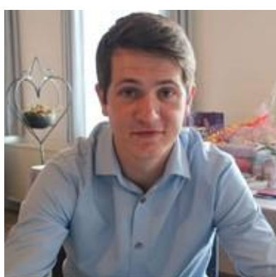
🙄 MANUTD 🙄