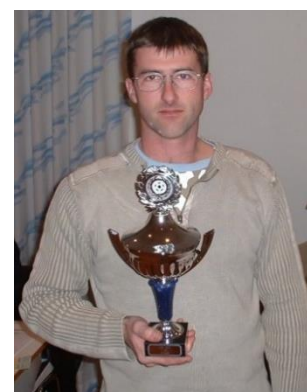
🙄 MIKKEL 🙄

🙄 CORK fra toppen af 3. Liga havde fat i billetten til Mellemrunden, men i den afsluttende fase i slutkampen mod MANUTD , kiksede det og CORK fik kun hentet et uafgjort resultat hjem og dumpede dermed ned under stregen og så er det slut for CORK . MANUTD fra bundområdet i Ligaens 3. division, havde før den sidste kamp, kun en meget teoretisk chance for at komme videre, men med det afsluttende uafgjorte resultat mod CORK , var alle chancer forduftet og Liga Cup 2023 er forbi for MANUTD . MIKKEL fra den bedste række har fine pairer i form af Liga Cup Mesterskabet i 2016 og 3. pladsen i 2021, men MIKKEL var også ude i teoretiske betragtninger inden den sidste kamp, men med det afsluttende nederlag mod FOREST forsvandt alle muligheder og MIKKEL er færdig i Liga Cup for denne gang 🙄