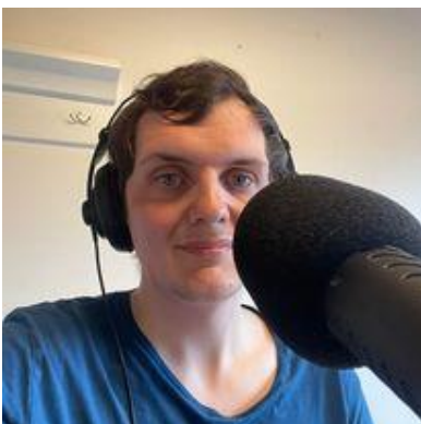
😞 CHELSEA 😞

😊 FOX fra 2. Liga, havde allerede inden den sidste kamp, sikret sig en billet til Mellemrunden, så en forsigtig uafgjort slutkamp mod CHELSEA sluttede en succesfuld Indledende runde af for FOX , der hermed er klar til Mellemrunden. FOX har en 2. plads fra Liga Cup 2009 og en 3. plads fra Liga Cup 2013 i bagagen. STEAM lå over stregen inden sidste kamp, men skulle bruge en sejr for at være helt sikker, så STEAM var helt oppe på dupperne og fik hevet en lidt overraskende afsluttende sejr hjem mod DEGNEN og dermed var STEAM klar til Mellemrunden. DEGNEN fra toppen af 3. Liga skulle bruge en sejr i den sidste kamp for at være helt sikker på at komme videre, men det blev dog til et nederlag mod STEAM , men de øvrige resultater flaskede sig for DEGNEN , der blev på den rigtige side af stregen og dermed er videre til Mellemrunden 😊