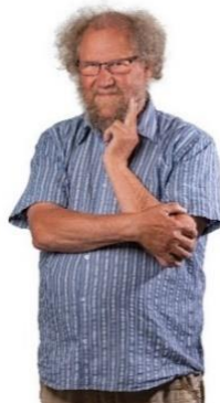
😊 STEAM 😊