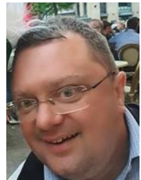
😞 FUTTE 😞

😞 CHELSEA fra 2. Liga kunne med en sejr i den afsluttende kamp, i heldigste fald slutte over stregen, men CHELSEA formåede kun at hive et uafgjort resultat hjem mod FOX og dermed er CHELSEA ude af årets Liga Cup. HARRY fra toppen af den bedste række, viste en skuffende omgang her i årets Liga Cup, der sluttede af med en uafgjort bundkamp mod FUTTE og så var Liga Cup'en 2023 forbi. FUTTE der også huserer i den bedste Liga-række, var også meget sløjt kørende i årets Liga Cup og da FUTTE måtte nøjes med uafgjort i den afsluttende kamp mod HARRY , forblev FUTTE fra den bedste række, sammen med HARRY også fra den bedste række, helt nede i puljens bund, totalt sat af og færdige 😞