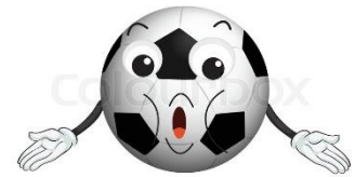
👤 BERTI 👤

👤 MCCOIST top-tipper i DT's 2. Division havde med placeringen et stykke under stregen, hårde odds inden den sidste kamp mod puljens toptipper NUSER. Kravet var en sejr og så håbe på det bedste og sejr det fik MCCOIST for alle pengene, idet NUSER blev totalt lammetævet, men trods puljens højeste sammenlagte score, så forblev MCCOIST lige under stregen, men Divisions Cup Eventyret er forbi for denne gang, men MCCOIST kan forlade banen med næsen i sky, som den eneste der fik skovlen under NUSER 👤 MAGPIES havde også chancen lige til det sidste og også MAGPIES sluttede af med en storsejr, nemlig over LIVPOOL , men det var lidt for sent at MAGPIES kom i gang og løbet er desværre kørt for MAGPIES for denne gang 👤 LIVPOOL havde før den sidste kamp, med placeringen lige over stregen, det ene ben i Mellemrunden, men det lykkedes ikke at få det andet ben med, så det blev til en nedtur efter nederlaget mod MAGPIES og dermed er LIVPOOL færdig i Divisions Cup'en 2023 👤 BERTI opgav ævred midt i turneringen, så derfor måtte reservesignaturen træde til for at få en retfærdig konkurrence i puljen og pr. automatik blev BERTI placeret på puljens sidsteplads 👤