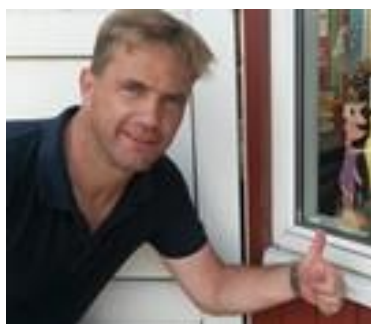
🚫 TYNDE 🚫