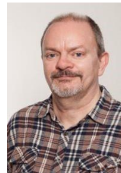
👤 SPVK 👤

👤 LUND opnåede en flot 2. plads i Divisions Cup 2007 og havde her i sæson 2023 en gylden chance for at komme videre fra den Indledende runde, for LUND lå lige over stregen inden den sidste kamp mod puljevinderen VIPTIP. Imidlertid skulle LUND hente en sejr og det lykkedes ikke, for med rundens laveste score, blev det kun til uafgjort og så var der dømt fintælling med MARSCHA, der var kommet op fra dybet og her glippede det for LUND , der hermed er ude af årets Divisions Cup 👤 KINKS har fine papirer fra Divisions Cup 'en, med fire 2. pladser i 1997, 2002, 2012 og 2021 og endelig Divisions Cup Mesterskabet i 1998. KINKS var dog på hælene inden den sidste kamp, som skulle vindes for at chancen ville være der, men med nederlaget mod FUTTE forsvandt alle forhåbninger og KINKS er færdig i Divisions Cup 2023 👤 FLINCA havde også chancen lige til det sidste, men kravet var en sejr for at chancen skulle være der, men det afsluttende nederlag mod NORWICH blev fatalt og FLINCA er færdig i årets Divisions Cup 👤 SPVK blev Divisions Cup Mester i 2014 og opnåede en 3. plads i 2015, men i denne sæson var SPVK så godt som sat af inden den sidste kamp og med det afsluttende nederlag mod MARSCHA, blev skæbnen cementeret og SPVK er færdig i årets Divisions Cup 👤