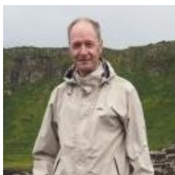
👤 LUND 👤