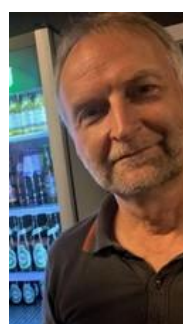
🚫 CULOPIP 🚫