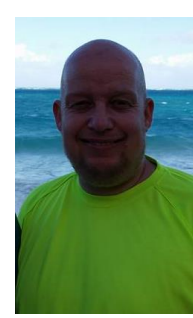
😊 KAILUA 😊