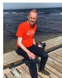
🚫 FOX 🚫