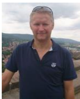
👤 KINKS 👤