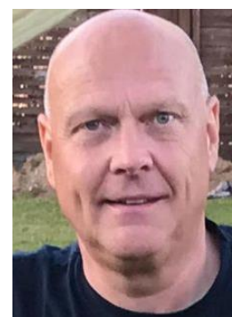
🤔 MORAN 🤔

🤔 CSKA skulle bruge en sejr i den sidste kamp mod FOREST, for at komme over stregen, men med det afsluttende nederlag mod FOREST, lykkedes denne mission ikke og CSKA der ellers vandt 3. Divisions Cup ´en i sidste sæson, forblev under stregen og er hermed færdig i Divisions Cup 2023 🤔 BRULA var sat af inden den sidste kamp, men BRULA afsluttede dog alligevel med maner og hev en stor sejr hjem over KAILUA, men Divisions Cup ´en er forbi for BRULA for denne gang 🤔 AYA havde ikke rigtig gang i hjulene og AYA havde den Indledende Rundes svageste samlede score, så Divisions Cup 2023 er forbi for AYA 🤔 MORAN har i denne sæson store problemer med at få Enkel-rækken til at spille og præstationen her i Divisions Cup ´en var ikke rigtig noget at skrive om og MORAN er færdig for denne gang 🤔