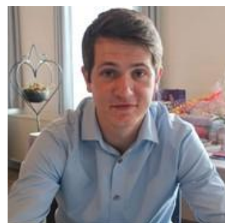
👤 MANUTD 👤