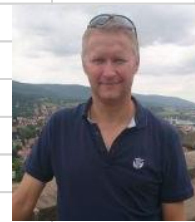
Kinks / Forest