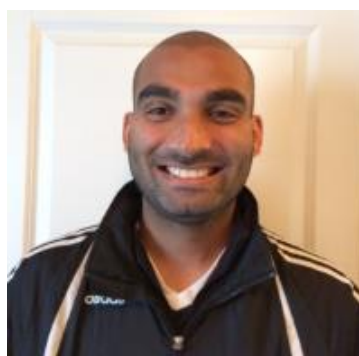
🤔 AYA 🤔