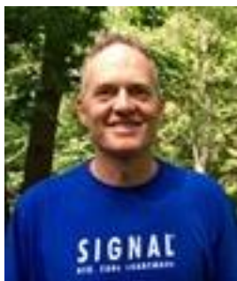
😊 ENYA 😊