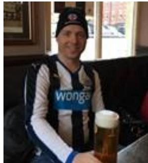
👤 MAGPIES 👤