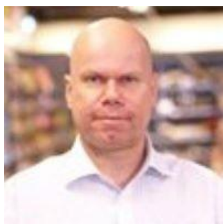
🚫 CORK 🚫