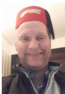
😊 FOREST 😊