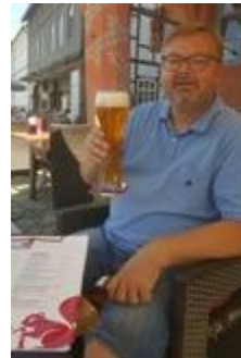
👤 HEDE 👤