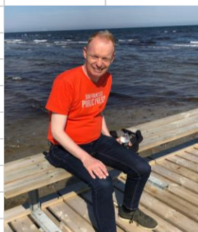
👤 Fox 👤