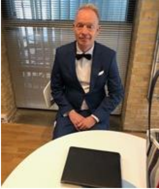
😊 PIQUET 😊

Pulje 2: BENBO (1), PIQUET (1), STOKE (1), NANDO (2), HEDE (3), SPVK (3).