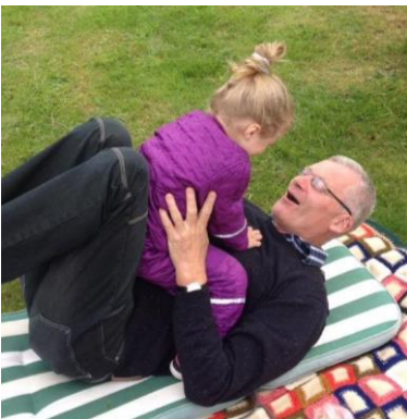
😞 BENBO 😞

😊 STOKE fra toppen af den bedste Liga-række, var før den sidste kamp hårdt presset lige over stregen, så det var nødvendigt med en sejr til STOKE i den sidste kamp mod HEDE og det lykkedes for STOKE at hive en storejre hjem og dermed er STOKE klar til Semifinalerunden 😊