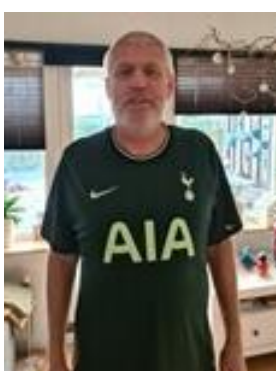
😞 SPURS 😞