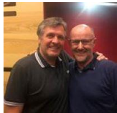
😞 NANDO 😞

😞 BENBO fra den bedste Liga-række var allerede sat af inden den sidste kamp, så kæmpe-sejren over NANDO hjalp ikke og BENBO er færdig i Liga Cup'en. HEDE lå lige under stregen inden den sidste kamp, der ellers var en afgørende kamp mod STOKE om billetten til Semifinalerunden, men HEDE fik et ordentlig slag og er hermed ude af årets Liga Cup. SPVK havde chancen lige til det sidste og med en sejr over PIQUET havde billetten været hjemme, men det blev til en på hatten i stedet for og dermed er SPVK ude af Liga Cup'en. NANDO var stort set ikke til stede i denne pulje og fik kun en enkelt pind ind på pointtavlen, så Liga Cup 2023 er forbi for NANDO 😞