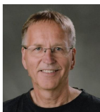
😞 DEGNEN 😞