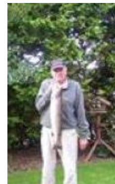
😞 VIPTIP 😞

😞 FAR havde før den sidste kamp en teoretisk chance for at komme over stregen, men det første krav – sejr – kiksede og det blev kun til uafgjort mod DEGNEN og dermed sluttede FAR under stregen og er ude af årets Liga Cup. SPURS skulle også bruge en sejr i den sidste kamp for at have en chance, men med det store nederlag mod ZICO forduftede enhver chance og SPURS er færdig i Liga Cup'en. DEGNEN var stået af inden den afsluttende uafgjorte kamp mod FAR og hermed er DEGNEN færdig i årets Liga Cup. VIPTIP var også sat helt af inden den sidste kamp, hvor VIPTIP dog sluttede af med et flot uafgjort resultat mod ARSENAL, men Liga Cup 2023 er forbi for VIPTIP 😞