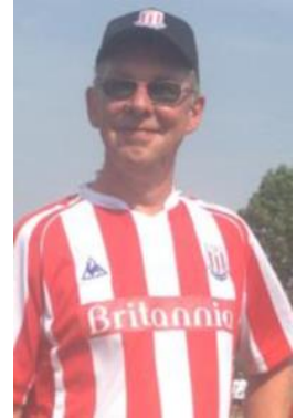
😊 STOKE 😊

😊 PIQUET fra den bedste Liga-række førte puljen inden den sidste kamp, men skulle bruge en sejr for at være helt sikker og det levede PIQUET helt op til med storejren over SPVK og dermed er PIQUET klar til Semifinalerunden 😊