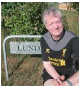
😊 ZICO 😊

Pulje 3: SPURS (1), ARSENAL (2), FAR (2), VIPTIP (2), ZICO (2), DEGNEN (3).