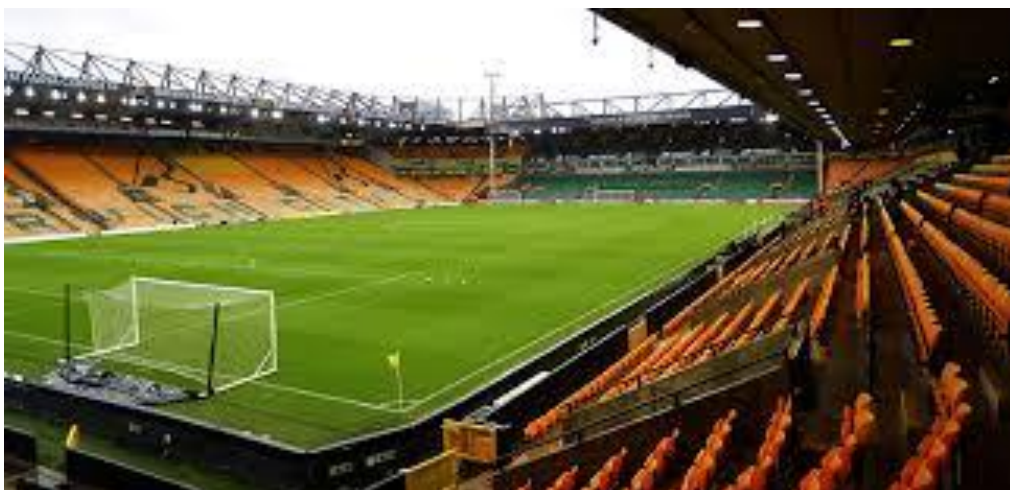
Carrow Road – Norwich City