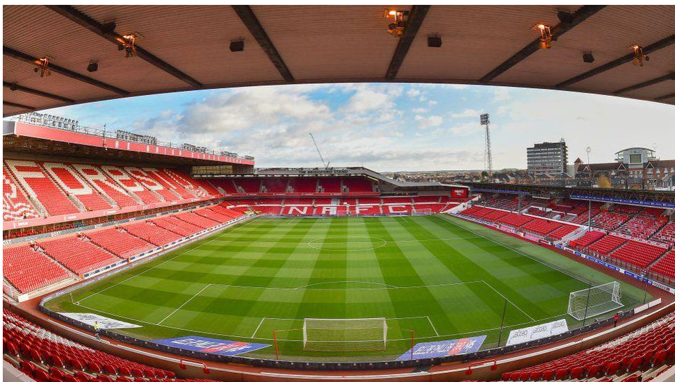
City Ground – Nottingham Forest FC