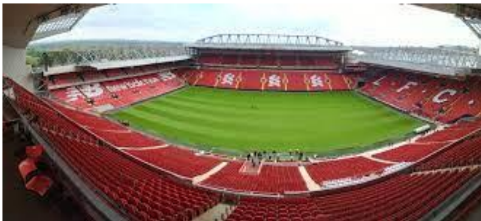
Anfield Road Stadium – Liverpool FC