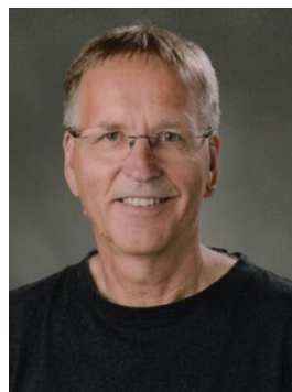
🙄 DEGNEN 🙄