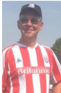
😊 STOKE 😊