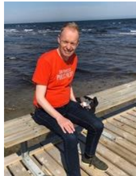
😊 FOX 😊