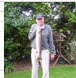
👤 Viptip 👤