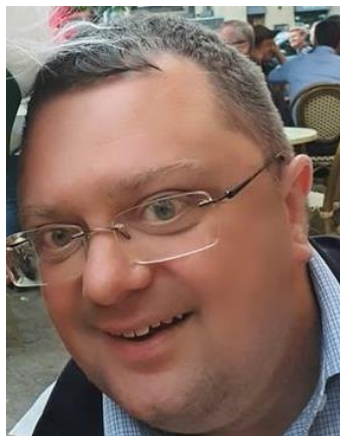
🙄 LIONS 🙄