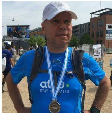
😊 CORK 😊