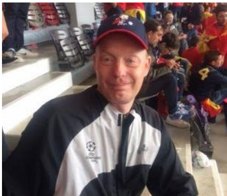
🙄 PIQUET 🙄