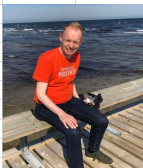
👤 Fox 👤