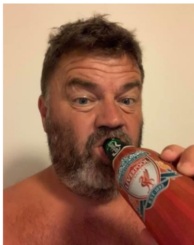
🙄 LFCSIF 🙄