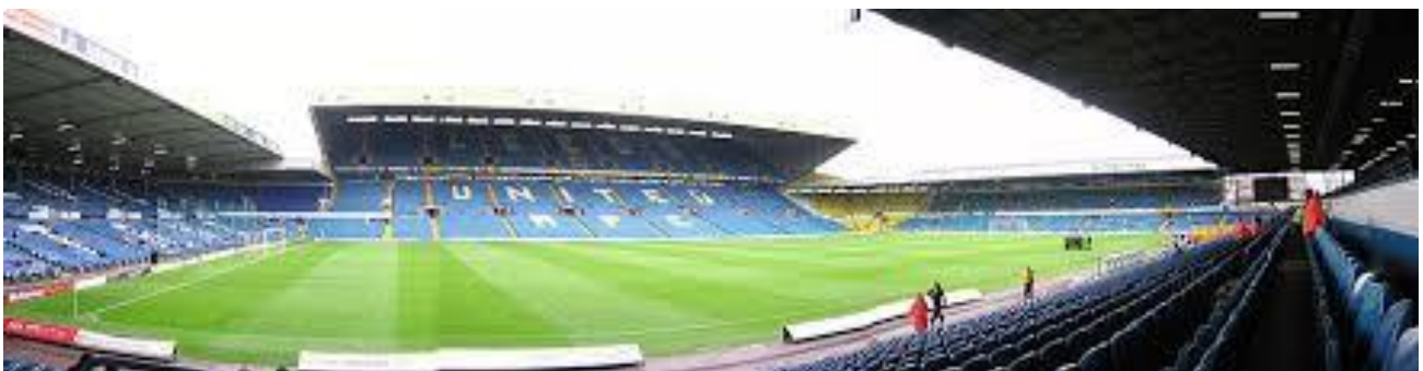
Elland Road – Leeds United Stadium