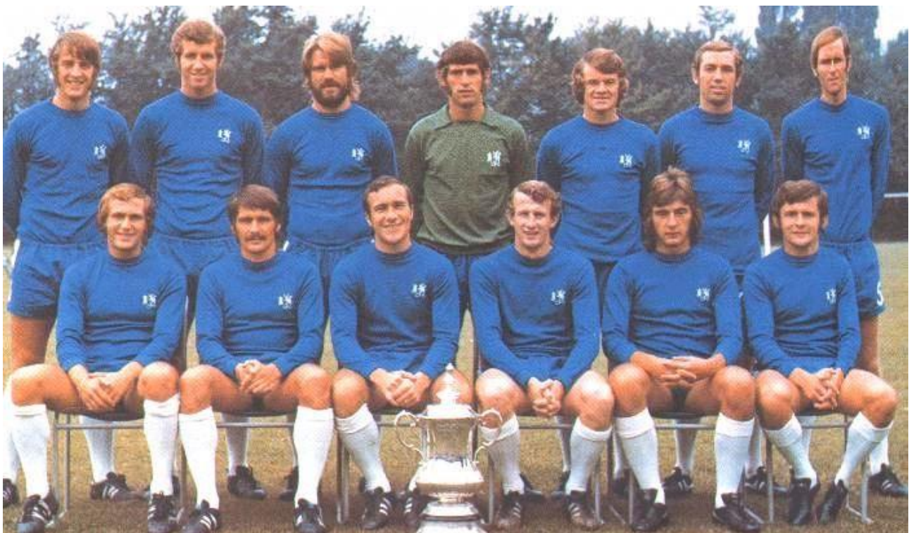
Chelsea FC 1970