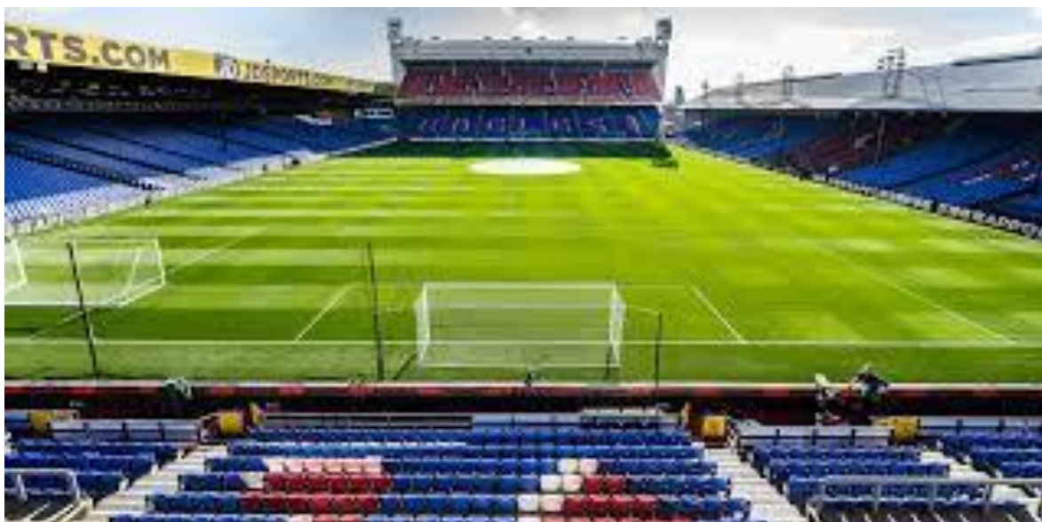
Selhurst Park – Crystal Palace Stadium