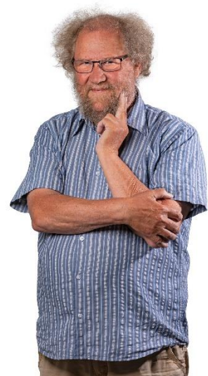
😞 STEAM 😞