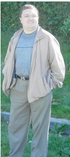
😊 DEVILS 😊

😊 DEVILS fra Liga ´ens 1. division, mødte her STEAM der nu er på besøg i Liga ´ens 3. division. DEVILS nåede helt frem til 3. runde i sidste sæson, hvorimod STEAM røg ud i 1. runde, så der var ingen tvivl om, at DEVILS var storfavorit. DEVILS var da også bedst på kampdagen, men også heldig, for DEVILS score var bestemt ikke imponerende, men STEAM ´s score var dog endnu ringere, så DEVILS videre til Liga Pokalens 2. runde, på en meget smal sejr 😊 STEAM er hermed færdig i Liga Pokalen for denne omgang 😞