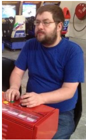
😊 HIMBO 😊