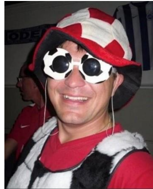
😊 ANDERUP 😊

😊 ARSENAL fra Liga ´ens bedste række var helt i top inden den sidste kamp, men det kunne godt gå galt, men selv om ARSENAL tabte så flaskede de øvrige resultater sig og ARSENAL blev hængende på den øverste plads og er dermed klar til Semifinalerunden 😊 ANDERUP fra Liga ´ens 3. division er som bekendt også ARSENAL-fan og man må jo sige det kører for ARSENAL og klubbens fans. ANDERUP var ikke sikker inden sidste kamp, men uafgjort mod LUFCMOT var nok og ANDERUP sluttede sikkert på puljens 2. plads og hermed er ANDERUP overraskende klar til Semifinalerunden 😊