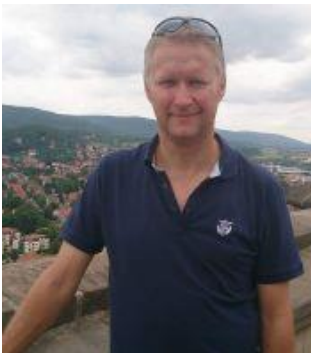
😞 KINKS 😞

😊 ARSENAL fra Liga ´ens bedste række var helt i top inden den sidste kamp, men det kunne godt gå galt, men selv om ARSENAL tabte så flaskede de øvrige resultater sig og ARSENAL blev hængende på den øverste plads og er dermed klar til Semifinalerunden 😊 ANDERUP fra Liga ´ens 3. division er som bekendt også ARSENAL-fan og man må jo sige det kører for ARSENAL og klubbens fans. ANDERUP var ikke sikker inden sidste kamp, men uafgjort mod LUFCMOT var nok og ANDERUP sluttede sikkert på puljens 2. plads og hermed er ANDERUP overraskende klar til Semifinalerunden 😊