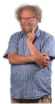
😞 STEAM 😞