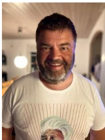
🙄 BORRIS 🙄