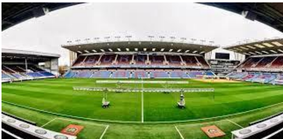
Turf Moor Stadium – Burnley FC