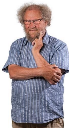
🙇 STEAM 🙇

1. Runde: ZICO (2) – STEAM (3) : (6 – 7, 8 – 6, 8 – 8, 6 – 6, 6 – 6, 3 – 4)