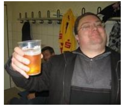
😞 DEVILS 😞

😞 KINKS den forsvarende Liga Cup Mester var under stregen inden den sidste kamp og var hermed hårdt presset, for der skulle en sejr til mod DEVILS, men det klarede KINKS ikke, for det blev kun til uafgjort og dermed er den forsvarende Liga Cup Mester KINKS overraskende ude af dette års Liga Cup 😞 LUFCMOT var sat af inden den sidste kamp mod ANDERUP, der sluttede uafgjort og det blev ikke til mere for LUFCMOT i årets Liga Cup og LUFCMOT er hermed ude 😞 STEAM lå inden sidste kamp helt i bund og uden chance for videre deltagelse, men det lykkedes dog for STEAM at pynte på stillingen, med den overraskende sejr over ARSENAL i den sidste kamp,- men Liga Cup ´en er forbi for STEAM 😞 DEVILS var ikke rigtig klar her i Mellemrunden og det blev kun til tre uafgjorte kampe, så Liga Cup 2022 er hermed forbi for DEVILS 😞