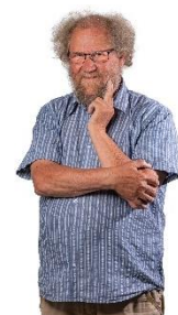
🙄 STEAM 🙄

😊 HIMBO der er debuterende tipper begynder nu at vise flaget og HIMBO er ved at være i sit livs bedste form. HIMBO skulle mindst have et enkelt point i den sidste kamp for at være sikker og det var ikke noget problem for HIMBO der storsejrede over brula i den sidste kamp og dermed tog HIMBO et hop op på puljens tronstol og er sikkert videre til Semifinalerunden 😊 brula havde allerede sikret sig videre deltagelse inden den sidste kamp, så den afsluttende afklapsning mod HIMBO betød ikke det store og brula sluttede alligevel på en hæderlig 2. plads og brula fik hermed hentet en sikker billet til Semifinalerunden 😊 CSKA lå før den sidste kamp og balancerede lige på stregen og CSKA skulle bruge en sejr for at være helt sikker på videre deltagelse og det krav klarede CSKA i den beskedne afsluttende sejr over BAMSE og dermed er CSKA klar til at stille op i Semifinalerunden 😊 BAMSE havde sikret sig billetten allerede inden den sidste kamp, så BAMSE tog det stille og roligt og måtte indkassere et beskedent nederlag mod CSKA i den sidste kamp, men trods 4. pladsen en meget sikker billet til Semifinalerunden til BAMSE 😊