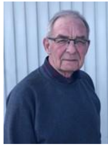
😊 BRULA 😊