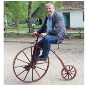
😊 BAMSE 😊