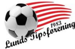
🙄 SELECT 🙄

1. Runde: SELECT (1) – LIVPOOL (3): (5 – 4)