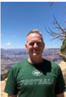
🙄 MARSCHA 🙄

😊 NUSER fra Liga ´ens 2. division var presset lige til det sidste, men med den afsluttende sejr mod VIPTIP, lykkedes det for NUSER at blive hængende på puljens 1. plads. NUSER kørte Mellemrunden igennem ubesejret og er nu klar til Semifinalerunden. NUSER har ingen tidligere Top 3 – præstationer her i Liga Cup ´en 😊 FAR også fra Liga ´ens 2. division var lige over stregen inden den sidste kamp og skulle ud i en vigtig afsluttende kamp mod MARSCHA lige under stregen. Kampen sluttede uafgjort og FAR blev hermed lige akkurat hængende over stregen og er nu klar til Semifinalerunden 😊