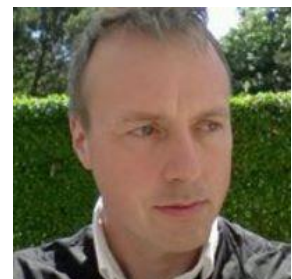
😞 FAR 😞

😊 FOX foreningens alvidende fodboldspecialist, har virkelig taget sig sammen her på det sidste og her i Mellemrunden gjorde FOX rent bord med 5 sejre på stribet, - aldeles suverænt. FOX har en 3. plads i Divisions Cup 2014 som bedste resultat. FOX er hermed klar til Semifinalerunden 😊 HARRY holdt fast i 2. pladsen på et hængende hår, trods en alvorlig afklapsning til DT's førende tipper KINKS i den sidste kamp, så heldet var med HARRY i det meget tætte felt, hvor FOX havde sat alle andre deltagere totalt af. HARRY er nu klar til Semifinalerunden 😊 STOKE hang usikkert lige over stregen før den sidste kamp, hvor STOKE med en svag score lidt heldig formåede alligevel at få hentet et point hjem og det var lige akkurat nok til at slutte på 3. pladsen og dermed er STOKE klar til Semifinalerunden 😊 KINKS der aspirerer meget kraftigt til DT-Mester-titlen, lå helt i bund inden den sidste kamp, men med rundens bedste score og en storsejr i den sidste kamp, fik KINKS lige netop hevet sig op over stregen efter fintælling og dermed er KINKS , der var Divisions Cup Mester i 1998 og med yderligere fire 2. pladser i bagagen, nu klar til Semifinalerunden 😊