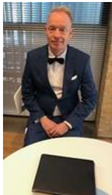
🙄 PIQUET 🙄