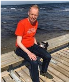
😊 FOX 😊