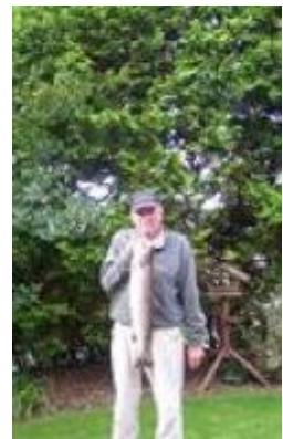
🙄 VIPTIP 🙄

🙄 MARSCHA fra den bedste række blev Liga Cup Mester 2014 og havde selv bolden i den sidste kamp mod FAR, men kampen skulle vindes og det glippede med det uafgjorte resultat og dermed blev MARSCHA under stregen og er ude af årets Liga Cup 🙄 PIQUET var allerede sat af inden sidste kamp, som ellers blev vundet, men løbet var kørt og PIQUET er ude af årets Liga Cup 🙄 SELECT skulle bruge en sejr i den sidste kamp mod PIQUET, for at have en chance, men det klarede SELECT ikke og dermed er SELECT færdig i Liga Cup ´en for denne gang 🙄 VIPTIP var ikke rigtig med i spillet i denne pulje og det blev kun til et enkelt point, så VIPTIP er ude for denne gang 🙄