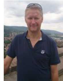
😊 KINKS 😊