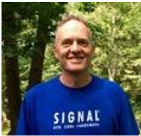
😊 ENYA 😊