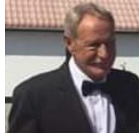
😊 VINDING 😊