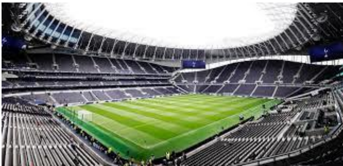
Tottenham Hotspur Stadium