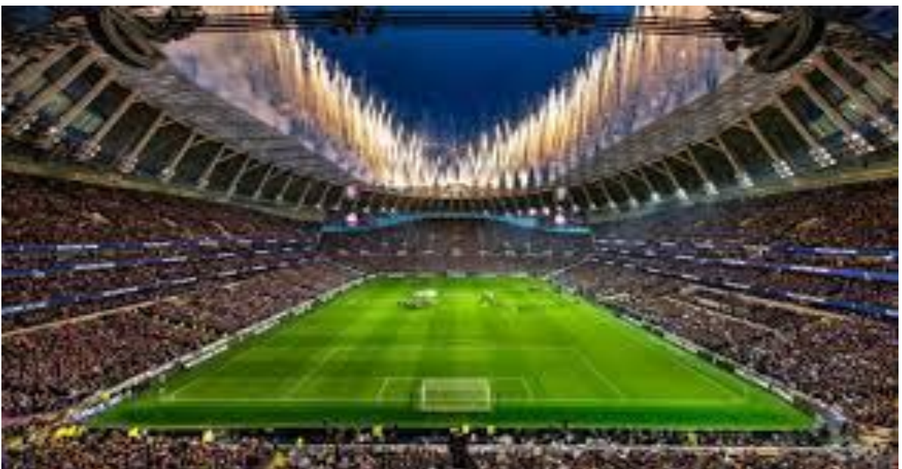
Tottenham Hotspur Stadium