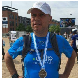
😊 BRAY 😊