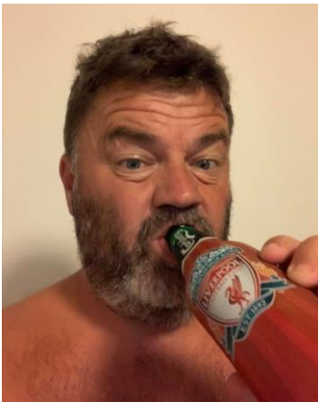
😞 LFCSIF 😞

😊 HALVOR lå fint på 1. pladsen inden den sidste kamp, men var alligevel ikke sikker, men trods en meget slap HALVOR - score i den sidste kamp, så var VINDING 's score endnu ringere og HALVOR hev sejren hjem og blev suveræn vinder af denne pulje og HALVOR er nu klar til Mellemrunden. CULOPIP var også under pres, men gik helt agurk her i den sidste kamp, hvor en pragtscore blev fyret af og LFCSIF blev tævet ud af banen. Så CULOPIP sikkert videre til Liga Cup'ens Mellemrunde. VINDING der opnåede en 2. plads i Liga Cup 2017, var meget hårdt presset på stregen og selv om det blev til et nederlag i den sidste kamp, lykkedes det for VINDING at blive hængende over stregen efter fintællingen 😊