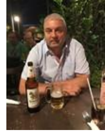
😊 NUSER 😊