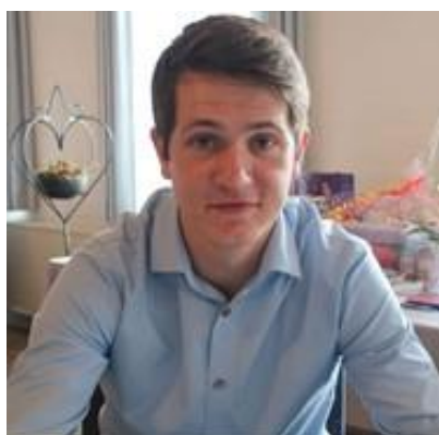
😞 MANUTD 😞