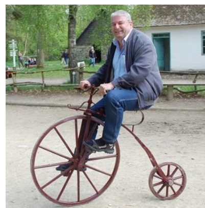
😊 NUSER 😊

😊 BORRIS fra Liga ´ens 3. division, var allerede sikret billet til Mellemrunden inden den sidste kamp, men holdt alligevel godt fast i puljens 1. plads, hvor BORRIS trods en afklapsning fra MANUTD, holdt stand. Så BORRIS er klar til Mellemrunden. ARSENAL lå og vippede på stregen, så den sidste kamp mod FRYDKÆR var meget afgørende og ARSENAL måtte hive en superscore frem for at besejre FRYDKÆR og sikre sig puljens 2. plads og billetten til Mellemrunden. NUSER skulle bruge mindst uafgjort i den afgørende kamp mod FOX og det var lige netop det der lykkedes for NUSER , der dog også måtte ryste op med en superscore. Så NUSER er nu klar til Liga Cup ´ens Mellemrunde 😊