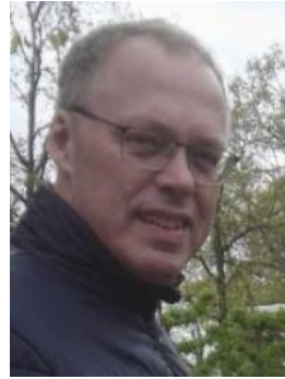
🙄 DERBY 🙄