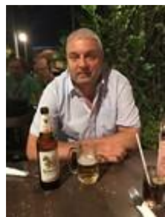
😞 BAMSE 😞

😞 DEGNEN ville med en sejr i den afsluttende kamp mod HIMBO, være gået videre her i denne super-tætte pulje, for det uafgjorte resultat var ikke nok og DEGNEN blev taber på de yderste marginaler efter fintællingen og er hermed ude af årets Liga Cup. LUCKY ville også med en afsluttende sejr over HÅRVARD, være gået videre, men da det kun blev til uafgjort for LUCKY , må vi konstatere at LUCKY er færdig her i årets Liga Cup. BAMSE der blev Liga Cup – Mester i 2007, hang noget i bremsen før sidste kamp og der skulle mirakler til i kampen mod MIKKEL. Men endnu engang må vi konstatere, at miraklernes tid er forbi for BAMSE , der hermed slutter puljen af og er færdig for denne gang 😞