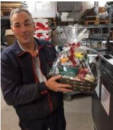
😊 LUCKY 😊

😊 BØLLE der igen er sat ind i Liga ´ens 3. division mødte her LUCKY fra 2. Liga og opgøret er en tro kopi af 1. kamp i sidste sæson, hvor det var BØLLE der rendte af med sejren, men dog blev slået i den efterfølgende kamp i 2. runde. BØLLE er med i topfeltet i Liga ´ens 3. division, hvorimod LUCKY bundet den i 2. Liga. En ret åbent opgør og det var da også helt lige i den 1. kamp, men så blev der tippet igennem i returkampen og BØLLE hev en komfortabel sejr hjem og er nu klar til Liga Pokalens 2. runde 😊 LUCKY må se i øjnene, at det kun blev til denne ene kamp i årets Liga Pokal Turnering 🙄