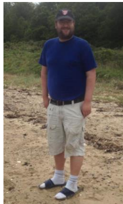
😊 HIMBO 😊