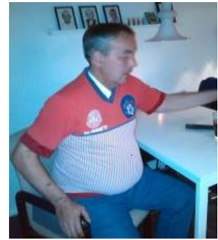
🙄 LUCKY 🙄

🙄 FLINCA fra toppen af den mellemste række, lå under strengen inden den sidste kamp, så der skulle en sejr til her, for at komme videre i turneringen, men det var mere end FLINCA kunne indfri og det blev til et nederlag mod MALTHE og dermed er FLINCA færdig i årets Divisions Cup 🙄 MORAN fra den bedste halvdel i 2. division, var hårdt presset under strengen inden den sidste kamp, hvor der skulle bruges en sejr for at have chance for at gå videre, men det spændte CULOPIP ben for med det afsluttende uafgjorte resultat og dermed må MORAN vinke farvel til Divisions Cup'en for denne gang 🙄 DERBY fra den tunge ende af den mellemste række, var allerede sat af, inden den sidste kamp, men derfor kan man jo godt slutte med manér og det gjorde DERBY med en flot sejr over PIQUET , - men Divisions Cup'en er slut for DERBY 🙄 LUCKY fra 2. divisions nedre halvdel, var for længst kørt af sporet og der var ingen chance for at komme på rette spor igen. LUCKY figurerer faktisk på den prestigefulde Divisions Cup Top 3 – Evighedstabel, hvor LUCKY i sin tid i den bedste række blev Divisions Cup Mester i 2015, men her i Divisions Cup 2022 er det slut for LUCKY for denne gang 🙄