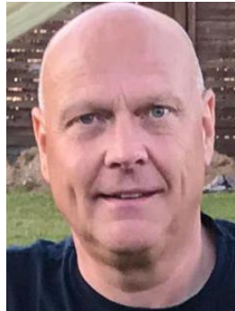
🙄 MORAN 🙄