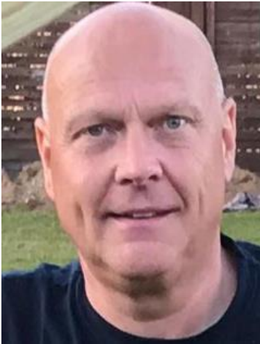
😊 MORAN 😊

😊 MORAN og LUCKY ligger side om side i DT's 2. division, dog er MORAN 's Enkel-Række betydelig bedre end LUCKY 's, så i kraft af dette var MORAN favorit i dette opgør. Det skulle dog vise sig at blive et mere jævnbyrdigt opgør end forventet og de tre første kampe sluttede alle uafgjort, men så fik MORAN lige sat et lille stød ind i den 4. kamp og så havde MORAN den psykologiske fordel i den 5. kamp, som MORAN da også stor-sejrede i. Dermed er MORAN lige som i sidste sæson videre til Pokal'ens 2. runde 😊 LUCKY må til gengæld i lighed med sidste sæson, forlade Pokalturneringens efter 1. runde 🙄