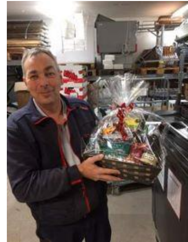
🙄 LUCKY 🙄