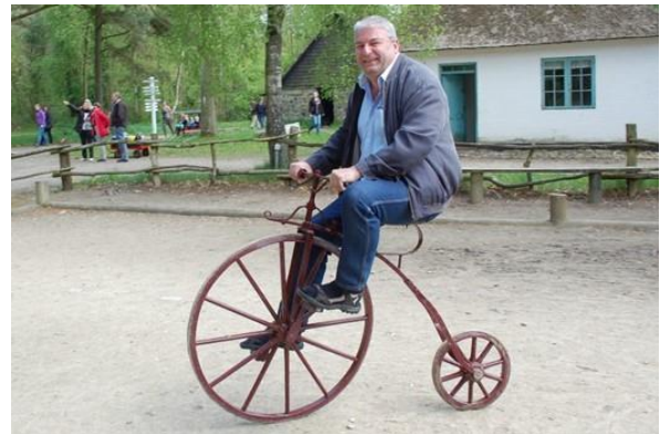
🙄 BØLLE 🙄