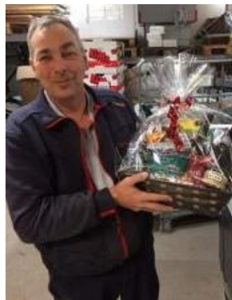
😞 LUCKY 😞