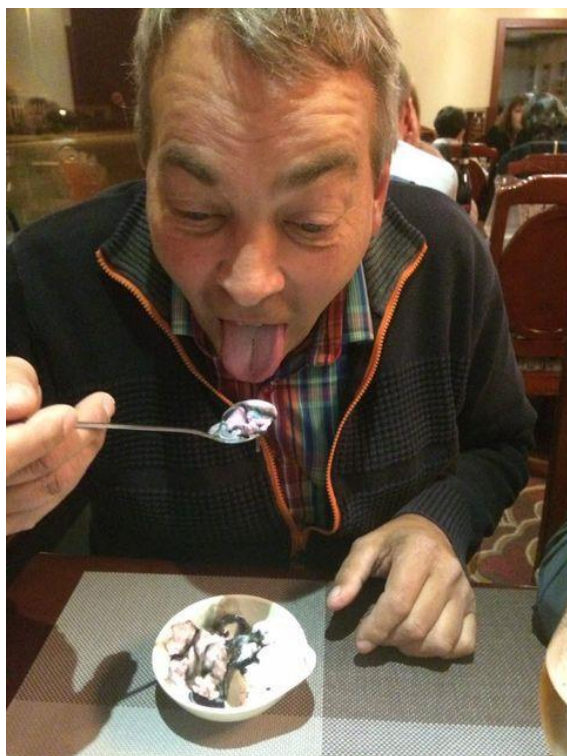
Paparazzi-foto af LUCKY

At blive bedre placeret end sidste år og måske liste lidt pengepræmier hjem. Ellers er det bare spændingen og håneretten over Vinding.