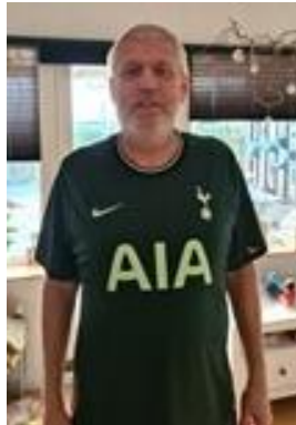
😊 SPURS 😊