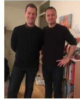
😞 HALVOR 😞

😞 TYNDE fra Liga ´ens 2. division havde inden den sidste kamp, næsten fri adgang til en Semifinalebillet, for i den afsluttende kamp skulle TYNDE "bare" have én mere end IDSKOV og så ville billetten være hjemme, men det blev en tynd omgang og TYNDE kunne kun klare uafgjort, så TYNDE må gå den tunge gang ud af årets Liga Cup 😞 CSKA fra Liga ´ens 3. division var sat af inden den sidste kamp mod SPURS, der endte uafgjort og dermed er CSKA færdig i Liga Cup ´en for denne omgang 😞 MIKKEL fra den bedste række blev Liga Cup Mester i 2016 og Nr. 3 i sidste sæson, men her i årets Liga Cup udeblev succesen og MIKKEL var allerede sat helt af inden den sidste kamp blev fløjtet i gang og hvor en umotiveret MIKKEL spillede uafgjort mod HALVOR og hermed forlader MIKKEL årets Liga Cup 😞 HALVOR der også er i den bedste Liga-række, gik helt ned med flaget her i Mellemrunden og det blev kun til tre uafgjorte kampe og hermed er HALVOR ude af Liga Cup ´en for denne gang 😞