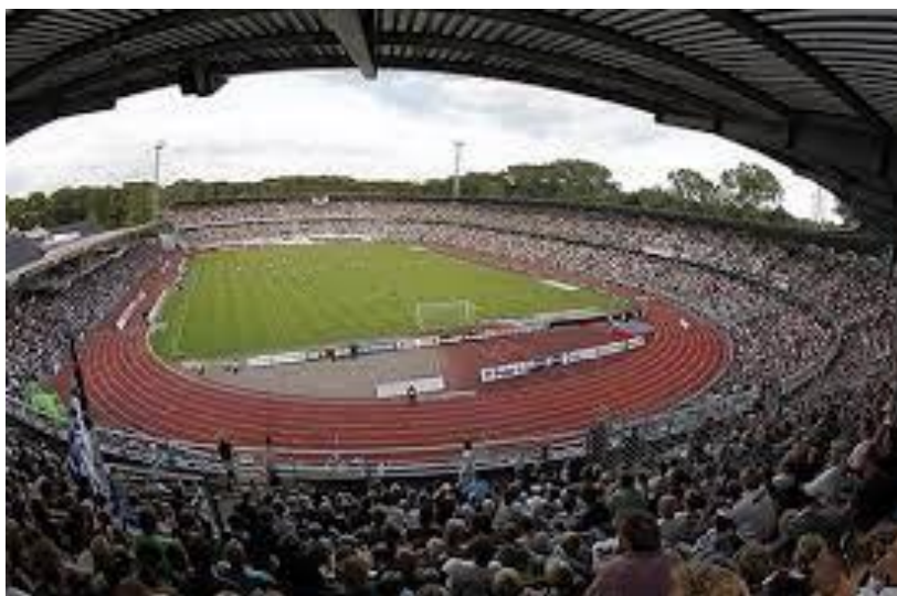
Aarhus Stadion – AGF