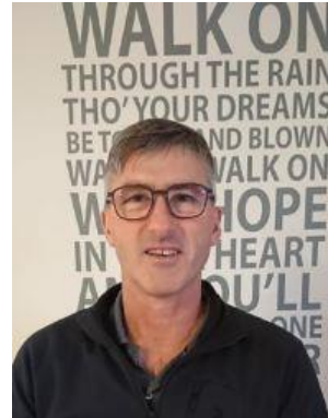
😊 IDSKOV 😊

😊 SPURS fra Liga ´ens bedste række, besatte puljens 1. plads inden den sidste kamp, men kun med en afsluttende sejr mod CSKA ville SPURS være helt sikker. Det blev dog kun til uafgjort, men SPURS blev alligevel hængende på puljens 1. plads og SPURS er hermed videre til Semifinalerunden 😊 IDSKOV fra den bedste række blev nr. 2 i Liga Cup ´en i sidste sæson og har endvidere et Liga Cup Mesterskab i 2004 og 2019 i bagagen. IDSKOV lå inden sidste kamp lidt uroligt lige over stregen og skulle møde TYNDE lige under stregen og vinderen var sikker på at gå videre,- men som alle afsluttende kampe i denne pulje blev det til uafgjort og dermed blev IDSKOV hængende på den rigtige side af stregen og IDSKOV er nu klar til Semifinalerunden 😊