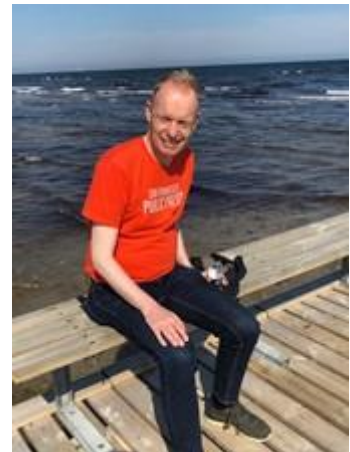
🙄 FOX 🙄