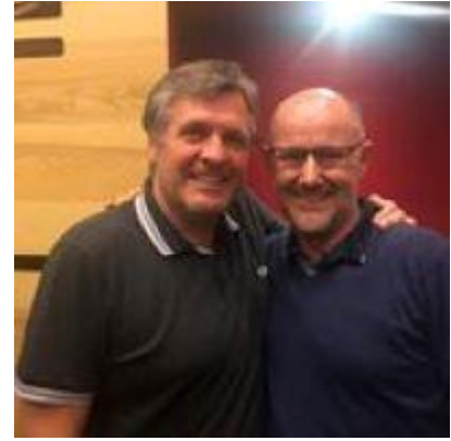
😞 NANDO 😞

😞 MAGPIES havde inden den sidste kamp, en spinkel chance for at komme videre, men flere resultater skulle flaske sig. MAGPIES fyrede en superscore af og vandt sikkert, så MAGPIES gjorde hvad han kunne, men alligevel blev MAGPIES taberen i fintællingen og MAGPIES sluttede lige under stregen og er hermed færdig i årets Liga Cup. FLINCA ville med en sejr i den afsluttende kamp mod FAR , være gået videre, men det blev kun til uafgjort og dermed er FLINCA færdig i Liga Cup'en. NANDO skulle også bruge en afsluttende sejr for at gå videre, men det lykkedes langt fra og NANDO fik en ordentlig lussing af MAGPIES og dermed var NANDO ude af årets Liga Cup 😞