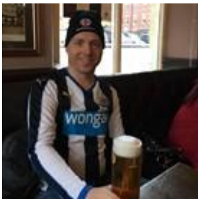
😞 MAGPIES 😞

😊 DEVILS fra den bedste Liga-række var sikret billet til Mellemrunden inden den sidste kamp, men alligevel sluttede DEVILS af med maner mod SPURS og fik hevet endnu en sejr hjem, så en aldeles suveræn 1. plads til DEVILS og en velfortjent billet til Mellemrunden. FAR skulle bruge mindst uafgjort i den sidste kamp, for at være sikker så FAR tog ingen chancer og FAR var godt tilfreds med det uafgjorte resultat mod FLINCA og dermed er FAR klar til Mellemrunden. SPURS lå og vippede på stregen og for at være helt sikker var det en sejr der skulle til i den sidste kamp, men her kiksede det helt for SPURS , der måtte indkassere et nederlag mod DEVILS . Men lidt mirakuløst lykkedes det alligevel for SPURS at blive over stregen, dog først efter fintælling, - men SPURS er klar til Mellemrunden 😊