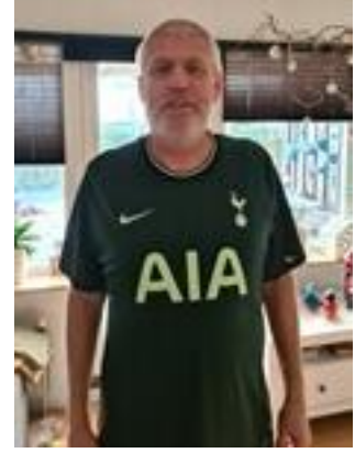
😊 SPURS 😊

😊 DEVILS fra den bedste Liga-række var sikret billet til Mellemrunden inden den sidste kamp, men alligevel sluttede DEVILS af med maner mod SPURS og fik hevet endnu en sejr hjem, så en aldeles suveræn 1. plads til DEVILS og en velfortjent billet til Mellemrunden. FAR skulle bruge mindst uafgjort i den sidste kamp, for at være sikker så FAR tog ingen chancer og FAR var godt tilfreds med det uafgjorte resultat mod FLINCA og dermed er FAR klar til Mellemrunden. SPURS lå og vippede på stregen og for at være helt sikker var det en sejr der skulle til i den sidste kamp, men her kiksede det helt for SPURS , der måtte indkassere et nederlag mod DEVILS . Men lidt mirakuløst lykkedes det alligevel for SPURS at blive over stregen, dog først efter fintælling, - men SPURS er klar til Mellemrunden 😊