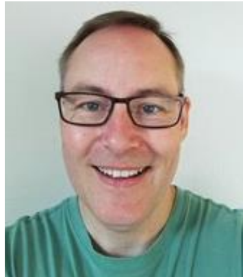
😞 FLINCA 😞