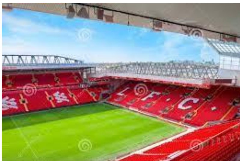
Anfield Road Stadium – Liverpool FC