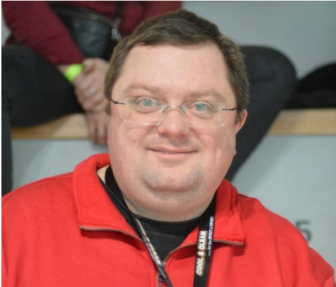
😊 DEVILS 😊