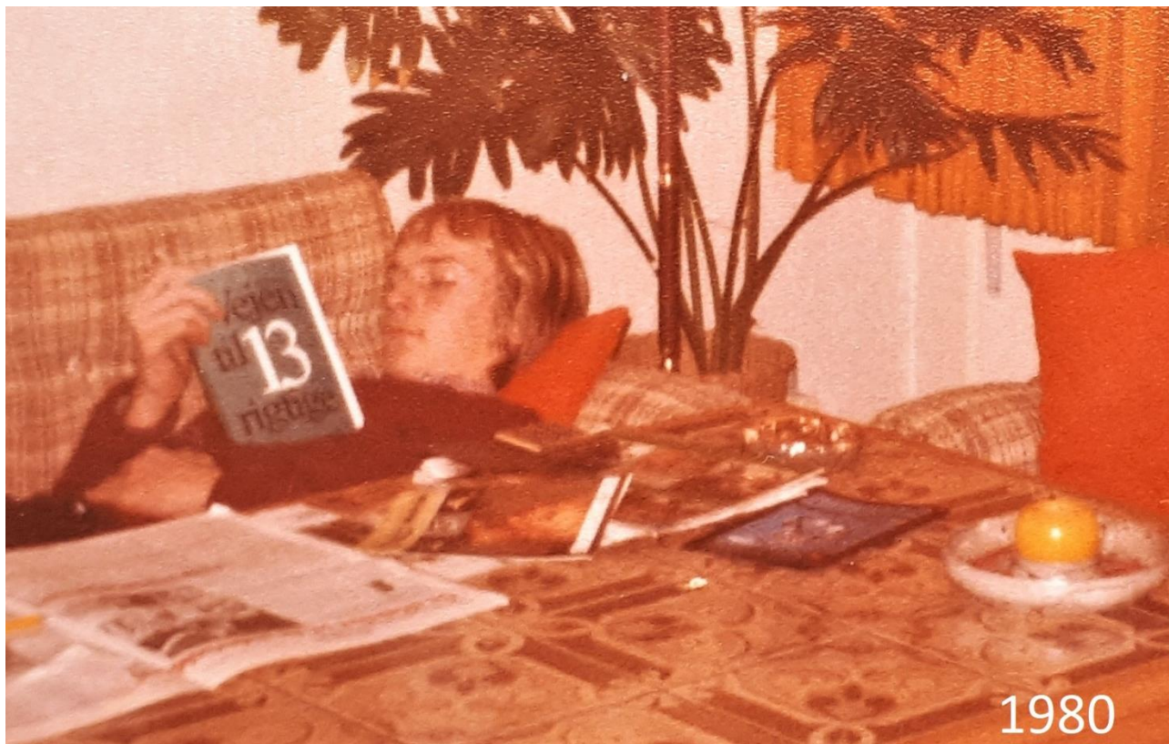
CULOPIP læser om vejen til 13 rigtige, på en ferie hos farmor i 1980

Så hurtigt som muligt at finde en spillestil, der kan give fast ophold i den bedre halvdel af DT 1. division. Lidt succes i en af side-turneringerne ville også gøre mig tilpas.