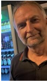
😞 CULOPIP 😞