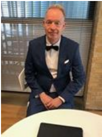
😊 PIQUET 😊