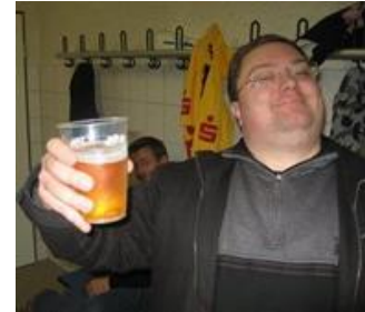
😞 TOFFEE 😞

😊 PIQUET der er FOX's 2. signatur, var inden den sidste kamp næsten helt sikker på puljens 1. plads og selv om PIQUET sluttede af med en ordentlig en på hatten i den afsluttende kamp mod FOREST , så lykkedes det for PIQUET , at holde fast i puljesejren og dermed er billetten klar til Semifinalerunden 😊 FOREST der er 2. signatur hos KINKS var truet lige til det sidste, så FOREST der blev Divisions Cup Mester i den bedste række i 2019, gav den fuld skrue i den afsluttende kamp mod PIQUET , der næsten blev fejet ud af banen og dermed er FOREST også klar til en tørn i Semifinalerunden 😊 AMIGO havde inden den sidste kamp, det ene ben i Semifinalerunden. AMIGO har særdeles fine papirer fra Divisions Cup'ens bedste række i form af to 3. pladser i 1988 og 2002, en 2. plads i 1996 og endelig Divisions Cup Mesterskabet i 2004. AMIGO tog ingen chancer og hentede lige et enkelt point i den sidste kamp mod CULOPIP og dermed er AMIGO klar til Semifinalerunden 😊 NORWICH lå inden den sidste kamp meget usikkert lige over stregen og der skulle en sejr til for at være sikker på at komme videre og det tog NORWICH meget alvorligt, for i den afsluttende kamp blev TOFFEE fejet ud af banen med en stor sejr. NORWICH har fine papirer fra tiden i den bedste række, i form af en 2. plads i 1999 og 2017 og kronen på værket Divisions Cup Mesterskabet i 2016, så nu er NORWICH foreløbig klar til Semifinalerunden her i Divisions Cup 2022 😊