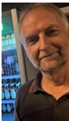
🙄 CULOPIP 🙄