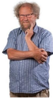
😊 STEAM 😊