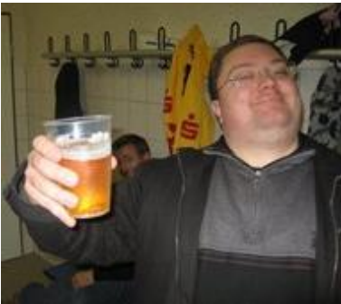
😊 TOFFEE 😊