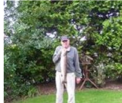
😊 VIPTIP 😊

😊 TOFFEE fra den bedste række var på hælene inden den sidste kamp og lå lige under strengen. Som den eneste i puljen præsterede TOFFEE dog superscore i den sidste kamp og det gik ud over FOREST, som blev vippet væk fra 1. pladsen og ned under strengen, mens TOFFEE selv indtog puljens 1. plads og dermed den eftertragtede billet til Mellemrunden. STEAM lå før sidste kamp i det store usikre felt, men det uafgjorte resultat mod VIPTIP holdt STEAM fast på puljens 2. plads efter fintælling blandt fire tippere og dermed er STEAM klar til Mellemrunden. VIPTIP var også med i det usikre felt, men også VIPTIP kom med til Mellemrunden efter fintællingen blandt de fire tippere 😊