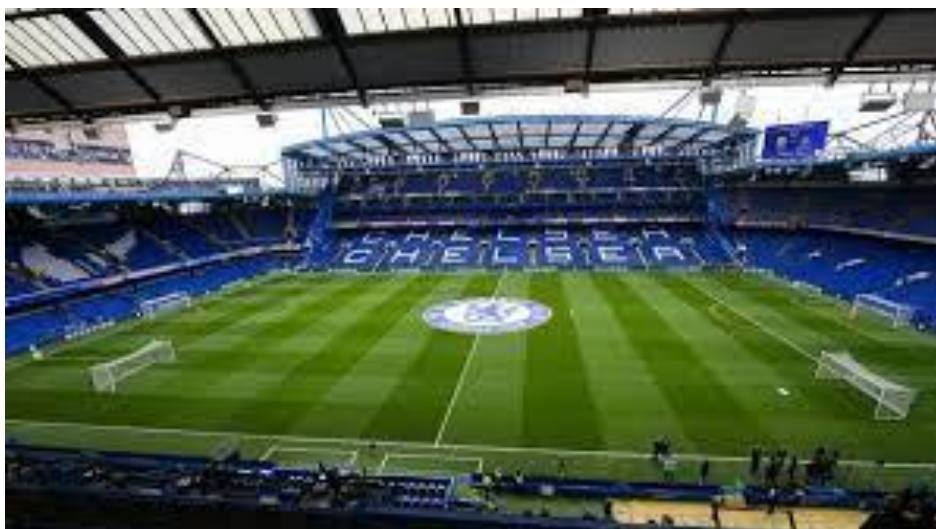
New Stamford Bridge Stadium – Chelsea