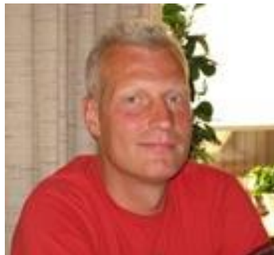
👾 SCHØN 👾