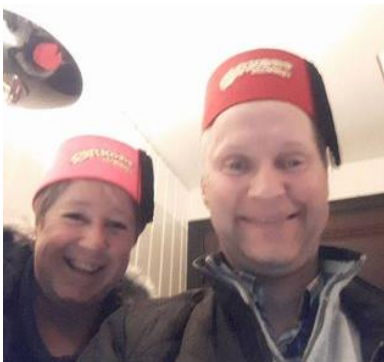
👾 FOREST 👾

😊 TOFFEE fra den bedste række var på hælene inden den sidste kamp og lå lige under strengen. Som den eneste i puljen præsterede TOFFEE dog superscore i den sidste kamp og det gik ud over FOREST, som blev vippet væk fra 1. pladsen og ned under strengen, mens TOFFEE selv indtog puljens 1. plads og dermed den eftertragtede billet til Mellemrunden. STEAM lå før sidste kamp i det store usikre felt, men det uafgjorte resultat mod VIPTIP holdt STEAM fast på puljens 2. plads efter fintælling blandt fire tippere og dermed er STEAM klar til Mellemrunden. VIPTIP var også med i det usikre felt, men også VIPTIP kom med til Mellemrunden efter fintællingen blandt de fire tippere 😊