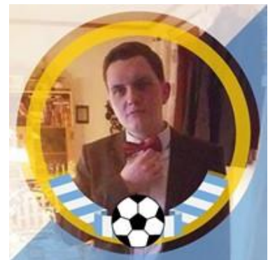
👾 CHELSEA 👾

👾 FOREST der blev nr. 3 i Liga Cup'en 2019, havde det ene ben i Mellemrunden og uafgjort i den sidste kamp havde været nok, men som puljens eneste tabte FOREST i den sidste kamp mod TOFFEE og det fik katastrofale følger og et fald fra 1. pladsen og ned under strengen, hvor fintællingen blandt de fire tippere afgjorde slagets gang. Så FOREST overraskende ude af årets Liga Cup. SCHØN Liga Cup – Mesteren 2020 skulle også have brugt en sejr i den sidste kamp mod CHELSEA, men det blev kun til uafgjort og efter fintællingen sluttede SCHØN under strengen og er hermed færdig i årets Liga Cup. CHELSEA var så godt som afskrevet inden den sidste kamp og med det uafgjorte resultat mod SCHØN forblev CHELSEA på puljens sidsteplads og er hermed færdig i Liga Cup 2022