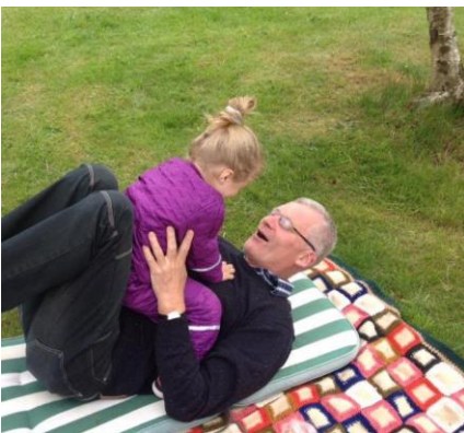
😞 BENBO 😞

😊 KINKS den forsvarende Liga Cup – Mester, har mange placeringer i Liga Cup'en, en 2. plads i 2007, samt 3. pladser i årene 2006 og 2016. KINKS var lidt truet lige til det sidste, men med en afsluttende pragtscore, blev BRULA på brutal vis banket ud af banen og KINKS er nu klar til Mellemrunden. MARSCHA Liga Cup – Mester 2014 var stærkt presset inden sidste topkamp mod BENBO, men det lykkedes for MARSCHA at fremvise en superscore, så det blev til en sejr og en fornem 2. plads i puljen og dermed adgang til Mellemrunden. CSKA lå under strengen før den sidste kamp, men med superscore her, kunne MURER intet gøre og CSKA fik med den afsluttende sejr, halet sig op på 3. pladsen og dermed er CSKA klar til Mellemrunden 😊