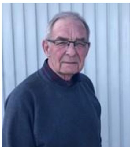
😊 BRULA 😊

😊 BRULA måtte se sig besejret i denne omgang og er hermed færdig i Liga Pokalen 🙄