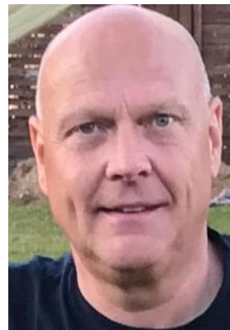
🙄 MORAN 🙄