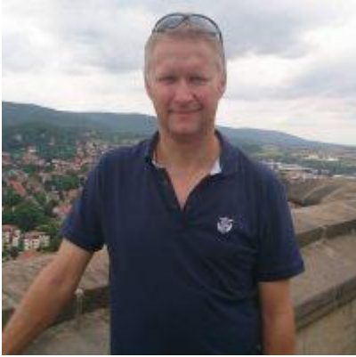
😊 KINKS 😊