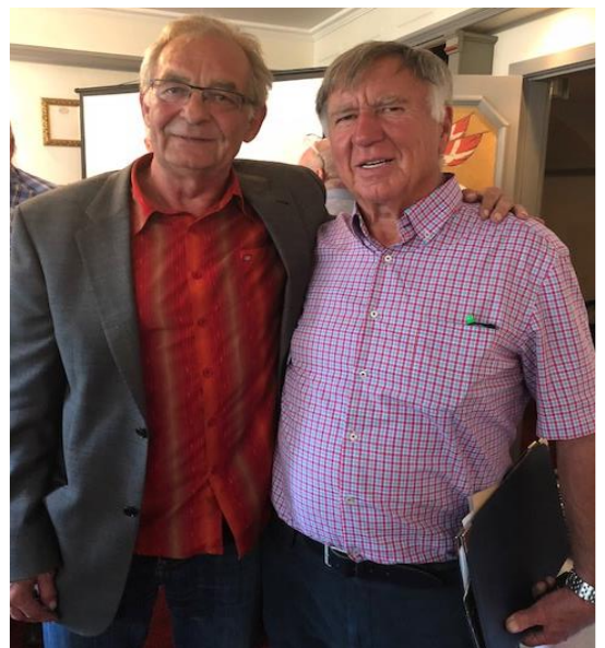
Bruno sammen med (andre) prominente personligheder – Sofie Gråbøl 😊 og Sepp Piontek 😊