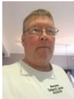
😞 MURER 😞