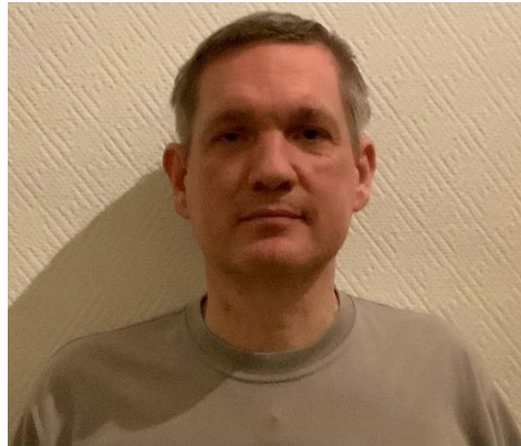
😊 AMIGO 😊