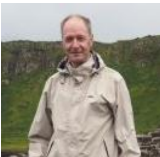
🚫 LUND 🚫