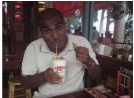
🙄 AYA 🙄