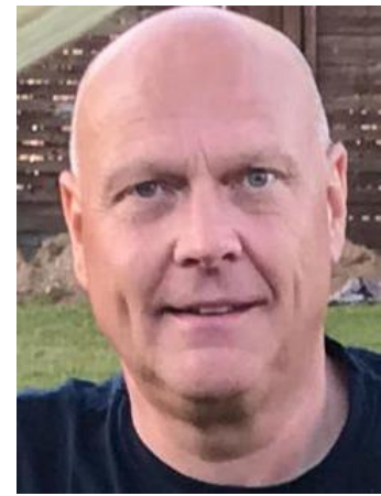
🙄 MORAN 🙄

🙄 FUTTE der blev nr. 3 i Liga Cup ´en 2018 lå inden den sidste kamp og lurede lige under stregen og et enkelt fejltrin højere oppe ville kunne hjælpe ham. Men selv om FUTTE selv gav den fuld skrue med superscore mod MORAN , hjalp sejren ikke og FUTTE forblev under stregen og er hermed ude af årets Liga Cup. AYA havde en teoretisk chance inden sidste kamp mod AMIGO , men det blev der sat en stopper for i nederlaget mod AMIGO . Så AYA er hermed færdig i årets Liga Cup. MORAN fra den bedste Liga-række, var helt ved siden af sig selv i årets Liga Cup og det blev kun til et enkelt point i de fem kampe og så er det helt sikkert forbi for MORAN for denne gang 🙄