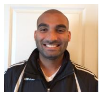
🚫 AYA 🚫

🚫 LUND fra den nedre ende af den bedste række, blev nr. 2 i denne disciplin i 2007 og skulle nu bruge en sejr i den sidste kamp, for at have en chance og det indfrie LUND med sejren over AYA , men så gik det galt i fintællingen, hvor fem tippere alle havde opnået 13 point og her manglede LUND lidt i egenscoren og blev altså den uheldige 5'er og sluttede derfor lige under stregen. Denne grumme skæbne led LUND også i sidste sæson, hvor LUND også røg ud efter fintælling blandt tre tippere med 13 point, så Divisions Cup 2022 er forbi 🚫 FRYDKÆR huserer i toppen af den bedste række og har været Divisions Cup Mester i 2002, men en alvorlig formkrise her i den Indledende Runde har været katastrofal for FRYDKÆR i denne sæson og der var krav om en sejr i den sidste kamp for at komme videre, men det satte IDSKOV en stopper for og så forblev FRYDKÆR under stregen og må overraskende forlade årets Divisions Cup 🚫 IDSKOV den forsvarende Divisions Cup Mester med Mesterskaber i 1989 og 2021, har også haft en lille formkrise i perioden med Divisions Cup'ens Indledende Runde og det medførte sensationelt, at IDSKOV allerede var sat helt af inden den sidste kamp, så IDSKOV 's afsluttende sejr over FRYDKÆR var kun af kosmetisk betydning, for IDSKOV er ude af årets Divisions Cup 🚫 AYA der bundter den bedste række fik hentet to sejre i de ni kampe, resten blev tabt og så blev slutresultatet en placering i bunden af den pulje og Divisions Cup'en er forbi for AYA for denne gang 🚫