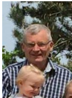
🚫 FRYDKÆR 🚫