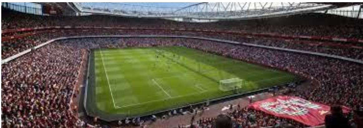
Emirates Stadium – Arsenal