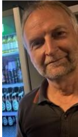
😊 CULOPIP 😊