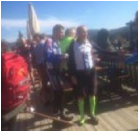
AGGER på cykeltur