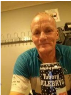
🙄 AGGER 🙄

De fire signaturer i puljen, der ikke klarede den: