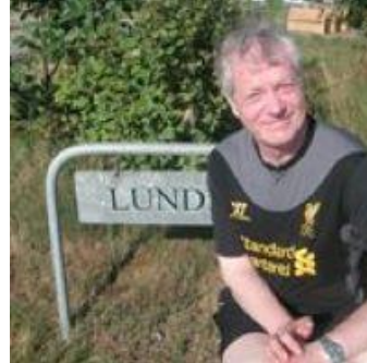
🙄 ZICO 🙄