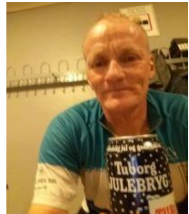
🙄 AGGER 🙄