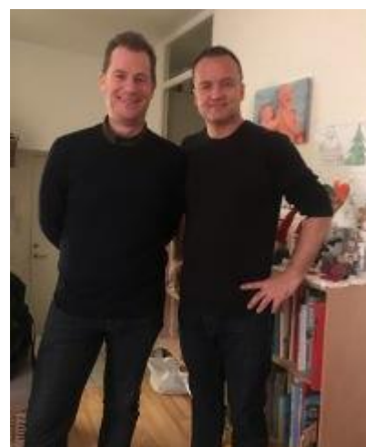
😊 HÅRVARD 😊