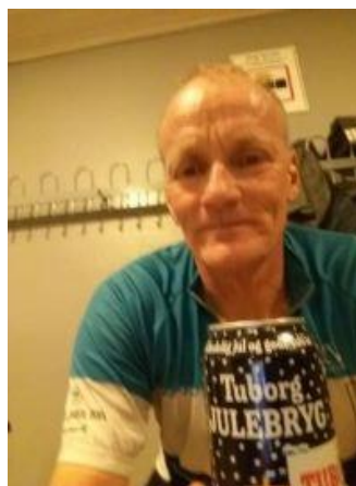
🙄 AGGER 🙄