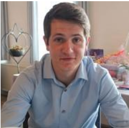
😊 MANUTD 😊

😊 MANUTD fra Danmarksturneringens 3. division skulle her prøve kræfter med AGGER fra den næstbedste række. I henhold til MANUTD fine udlæg på sæson 2022 og AGGER 's lidt svage start, var MANUTD svag favorit. MANUTD nåede frem til 3. runde i sidste sæson og i opgøret mod AGGER blev der lagt ud med en opvarmingskamp, der sluttede uafgjort, men i den 2. kamp fik MANUTD hevet en smal sejr hjem og det var et godt udlæg til den 3. kamp, hvor MANUTD hev en stor-sejr hjem og dermed var billetten hjemme til Pokalturneringens 2. runde 😊 AGGER måtte for 2. sæson i træk forlade Pokal'en efter 1. runde 🙄