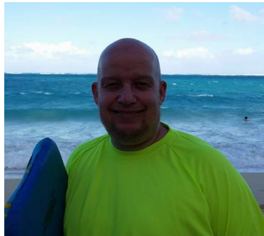
🙄 KAILUA 🙄