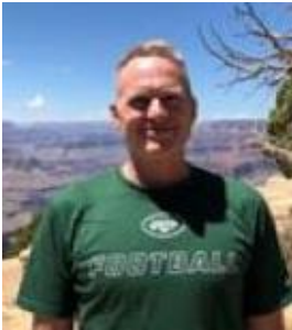
😊 MARSCHA 😊