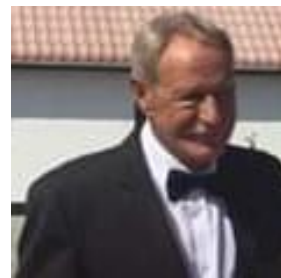
🙄 VINDING 🙄

😊 ENYA der har MARSCHA` s fine tipsgener i sig, havde sikret sig Finaleplads allerede inden den sidste kamp og det var vist meget godt, for her tabte ENYA mod FOREST . Trods nederlaget sluttede ENYA sikkert på puljens 1. plads og en velfortjent Finalebillet er klar 😊 NORWICH har stolte traditioner i Divisions Cup ´en og med to 2. pladser og et Divisions Cup Mesterskab i den bedste række i 2016, var det ventet at NORWICH ville klare skærene og sikre sig en Finalebillet. NORWICH skulle vinde den sidste kamp mod VINDING , for ifald det blev uafgjort kunne det ende med fintælling. Det blev dog uafgjort, men med den fine score lykkedes det dog for NORWICH at vinde fintællingen og dermed sikre sig en Finalebillet 😊