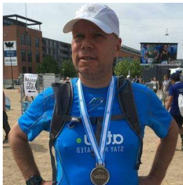
😊 BRAY 😊