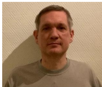
😞 AMIGO 😞