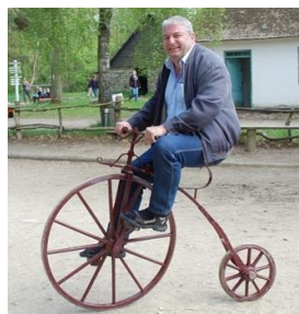
🙄 BAMSE 🙄