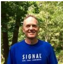
😊 ENYA 😊