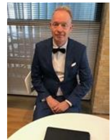
😊 PIQUET 😊