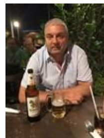
😞 NUSER 😞

😊 BRAY var sikret billet til Finalerunden allerede inden den sidste kamp mod PIQUET , der var i samme situation, så kampen var en ren træningskamp, hvor BRAY viste den absolut bedste form og dermed blev BRAY suveræn vinder af denne pulje med tre sejre på striben og BRAY er nu klar til Finalerunden 😊 PIQUET havde jo også billetten hjemme inden den sidste kamp og måske var det derfor at PIQUET slappede lidt af i træningskampen mod BRAY og indkasserede et stort nederlag, men det betød intet for Finalepladsen er klar til PIQUET 😊