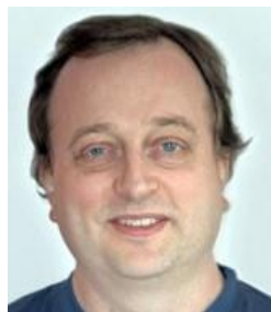
🙄 ARSENAL 🙄