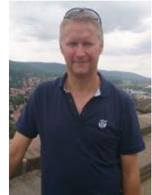
😊 KINKS 😊