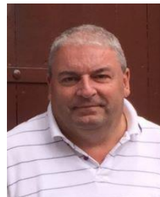
🙄 HARRY 🙄

😊 MARSCHA der er en af topprofilerne i den bedste række, havde før den sidste kamp, det ene ben i Finalerunden og med den afsluttende beskedne sejr over HARRY var succesen hjemme med fuldt hus her i Semifinalerunden og MARSCHA der i sidste sæson blev nr. 3 her i Divisions Cup'en er nu for 4. gang i løbet af de sidste fem sæsoner med i Finalerunden og der mangler kun Divisions Cup Mesterskabet 😊 KINKS toptipper og den førende tipper i DT, lå og jonglerede på stregen inden den sidste kamp mod toptipperen ARSENAL, så en kamp på allerhøjeste niveau. KINKS kunne liste en billet hjem med uafgjort, men for en sikkerheds skyld hentede KINKS en beskedne sejr hjem og dermed var vejen banet til Finalerunden. KINKS blev Divisions Cup Mester i 1998 og har endvidere tre 2. pladser i bagagen 😊