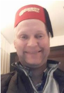
😊 UHRE 😊