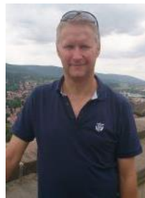
🙄 FOREST 🙄