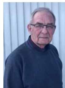
🙄 BRULA 🙄

😊 UHRE rækkens suveræne tipper, var helt sikker på en Finalebillet inden den sidste kamp mod BRULA , så det var ren afslapning for UHRE og det gik da også galt og BRULA vandt en komfortabel sejr, men UHRE med de fine gener er klar til Finalerunden 😊 DEGNEN lå inden den sidste kamp mageligt lige oven på stregen og skulle møde BAMSE i den sidste kamp, hvor uafgjort ville være nok til en Finalebillet og der var jo ingen grund til at overanstrenges sig, så DEGNEN fik hevet uafgjort hjem og dermed blev DEGNEN sikker vinder af fintællingen mellem BAMSE og DEGNEN og dermed er DEGNEN nu klar til Finalerunden 😊