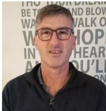
😊 IDSKOV 😊