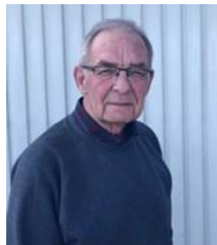
👎 brula 👎