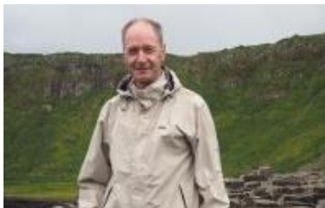
😞 LUND 😞