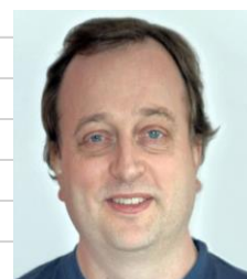
👤 Arsenal 👤