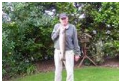
🙄 VIPTIP 🙄

1. Runde: SELECT (1) – VIPTIP (1) : (5 – 6, 6 – 7)