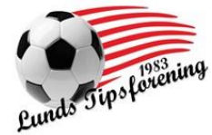
😊 CULOPIP 😊

1. Runde: NUSER (2) – CULOPIP (2) : (5 – 6, 7 – 8)