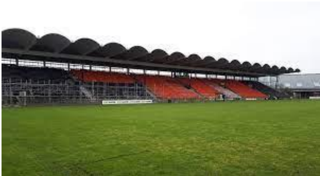
Valby Idrætspark – BK Frem