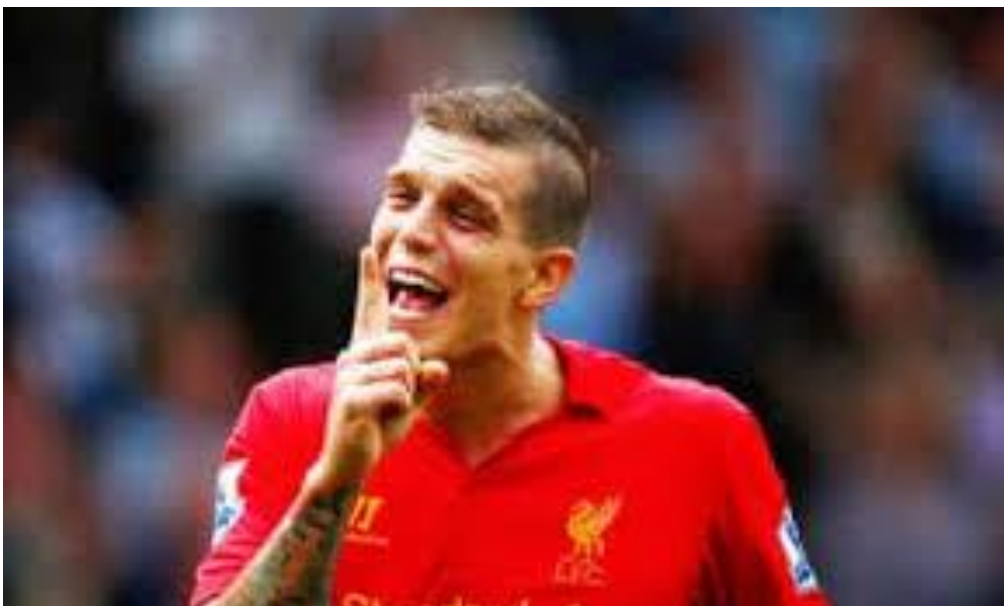
Daniel Agger – FC Liverpool