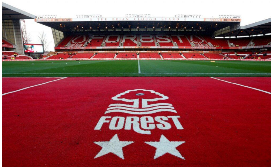
City Ground – Nottingham Forest FC