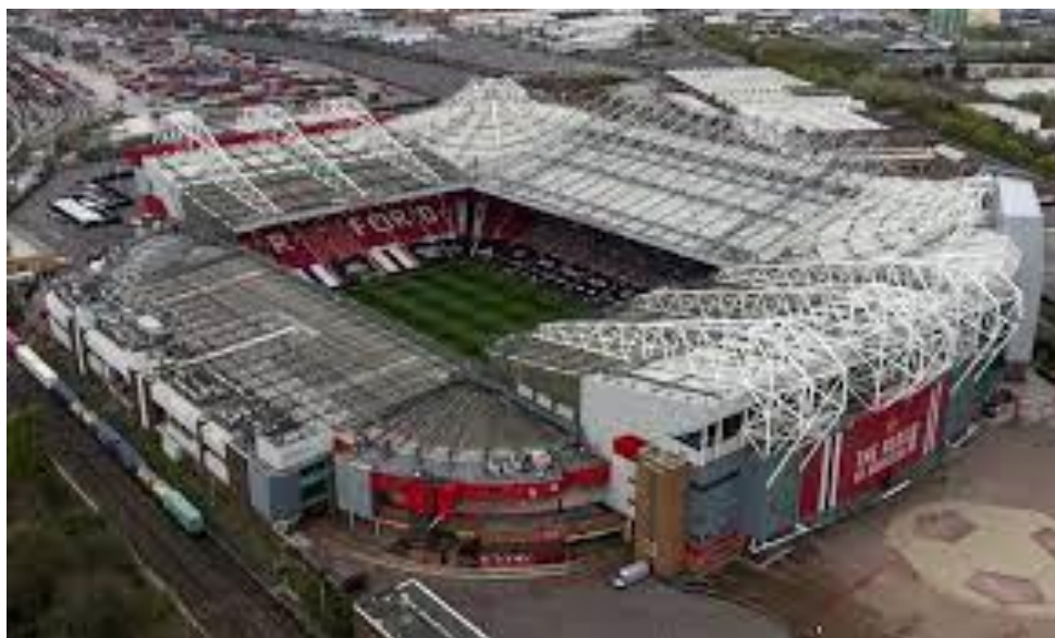
Old Trafford – Manch. United