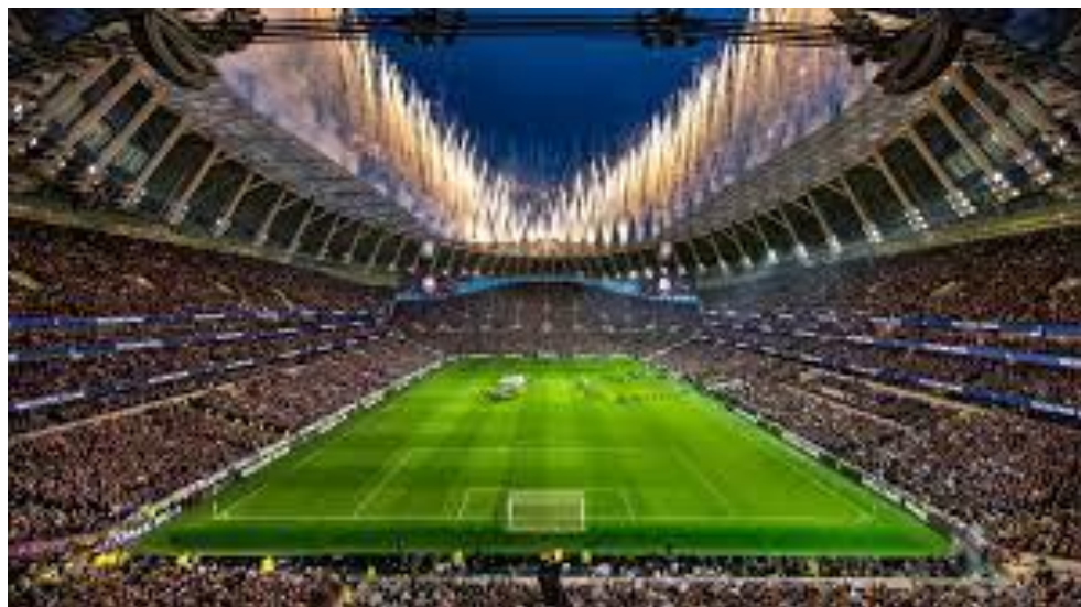
The New Tottenham Hotspur Stadium