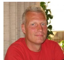
MURER MARSCHA FAR