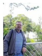
CULOPIP MURER LIVPOOL SCHØN LUCKY HEDE

↑ NR. 7 TIL 12 EFTER 11 KAMPE, ER FÆRDIGE I TURNERINGEN ↑