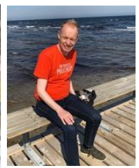
😊 FOX 😊