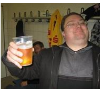
😞 TOFFEE 😞

😞 TOFFEE der i sidste sæson blev nr. 2 her i Divisions Cup´en, havde ikke set den komme, - altså efter 8 uger i feltet over stregen, fik han stødet af FOX i den sidste kamp og hermed røg TOFFEE ned under stregen, - det var noget af en bet 😞 FUTTE fra den samme familie led samme skæbne og dumpede ned under stregen i sidste runde efter et smalt nederlag i den sidste kamp mod puljevinderen MALTHE. En bitter skæbne for FUTTE der i sidste sæson blev nr. 3 😞 FRYDKÆR der blev Divisions Cup – Mester i 2002, havde en meget teoretisk chance lige til det sidste, men det blev til et nederlag i den sidste kamp, så FRYDKÆR er ude af årets Divisions Cup 😞 FOREST var langt fra formen i 2019, hvor FOREST blev Divisions Cup – Mester og årets Divisions Cup blev til en rigtig dårlig oplevelse for FOREST der sluttede i bund i puljen, langt fra billetten til Mellemrunden 😞