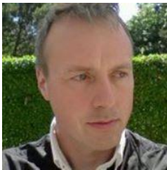
😊 FAR 😊