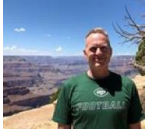
😊 MARSCHA 😊

😊 HEDE debutanten havde en fantastisk serie med 4 sejre ud af de 5 kampe og det medførte en sikker puljesejr til HEDE foran prominente 1. Liga-tippere og med det højeste pointtal i den Indledende Runde, så det må siges at være en imponerende præstation. HEDE er nu sendt videre til Mellemrunden. VINDING der opnåede en 2. plads i Liga Cup'en i 2017, gjorde det også rigtig godt og slap ubesejret gennem den Indledende Runde og det medførte en stensikker 2. plads i puljen til VINDING og en adgangsbillet til Mellemrunden. MARSCHA der tog sig af Liga Cup – Mesterskabet i 2014, havde allerede sikret sig videre deltagelse før den sidste kamp og det var vist meget godt, for MARSCHA fik en dukkert i den sidste kamp, men MARSCHA er videre til Mellemrunden 😊