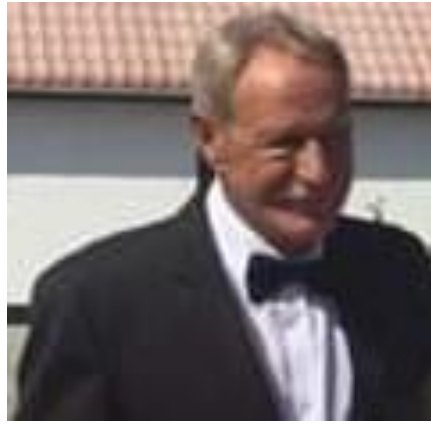
😊 VINDING 😊