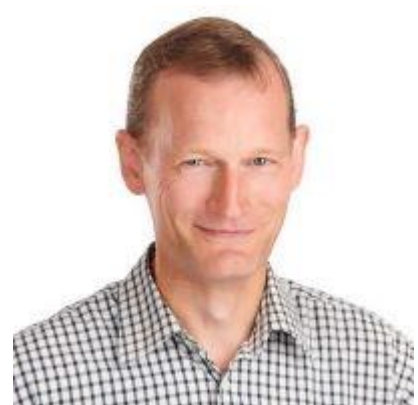
😞 PERCY 😞

😞 TOFFEE var allerede stået af før den sidste kamp og der var ikke længere chance for billet til Mellemrunden, men TOFFEE sluttede dog af med maner og en sejr, hvilket også blev TOFFEE 's eneste i den Indledende Runde. TOFFEE er færdig for denne gang. FAXE vandt den 1. kamp i den indledende runde, men herefter måtte FAXE indkassere 4 nederlag på striben og så var Liga Cup'en 2021 forbi for FAXE for denne omgang. PERCY opnåede kun to uafgjorte resultater i de fem kampe og det var lige i underkanten til at komme i nærheden af de eftertragtede billetter til Mellemrunden, så det er slut for PERCY her i årets Liga Cup 😞