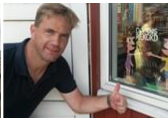
😊 TYNDE 😊