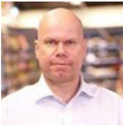
😊 CORK 😊