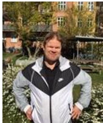
😞 FAXE 😞