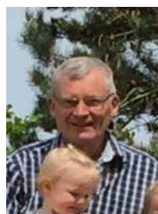
😞 FRYDKÆR 😞