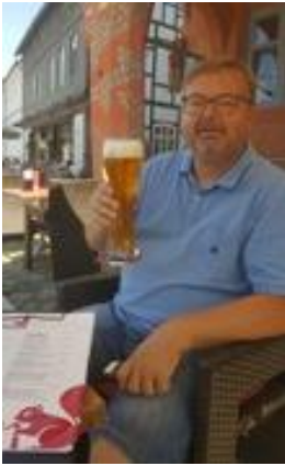
😊 HEDE 😊