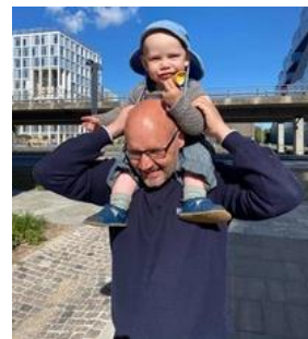
🙄 NISSE 🙄

🙄 NUSER der er suveræn bundprop i Liga´ens 1. division, havde sat næsen op efter mere, men tipsevnerne manglede i høj grad og NUSER var sat af længe før den sidste kamp og så var det sket for NUSER her i Liga Cup´en, hvor NUSER i øvrigt aldrig har opnået topplacering 🙄 LIVPOOL debutant ligger og balancerer på den kritiske streg i Liga´ens 3. division og her i Liga Cup´en var det ikke det store der blev præsenteret og Liga Cup 2021 er forbi for LIVPOOL 🙄 VINDING der er under stregen i Liga´ens bedste række, var også meget ringe kørende her i Mellemrunden og selv om det lykkedes, at hive en sejr hjem her i den sidste kamp, så var løbet for længst kørt og VINDING` s 2. plads i 2017 er stadig VINDING` s bedste resultat 🙄 NISSE debutanten fra den nedre halvdel af Liga´ens 3. division, gik helt rabundus her i Liga Cup´ens Mellemrunde og høstede kun et enkelt point i de fem kampe og Liga Cup´en er slut for denne gang