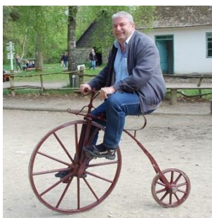
🙄 NUSER 🙄